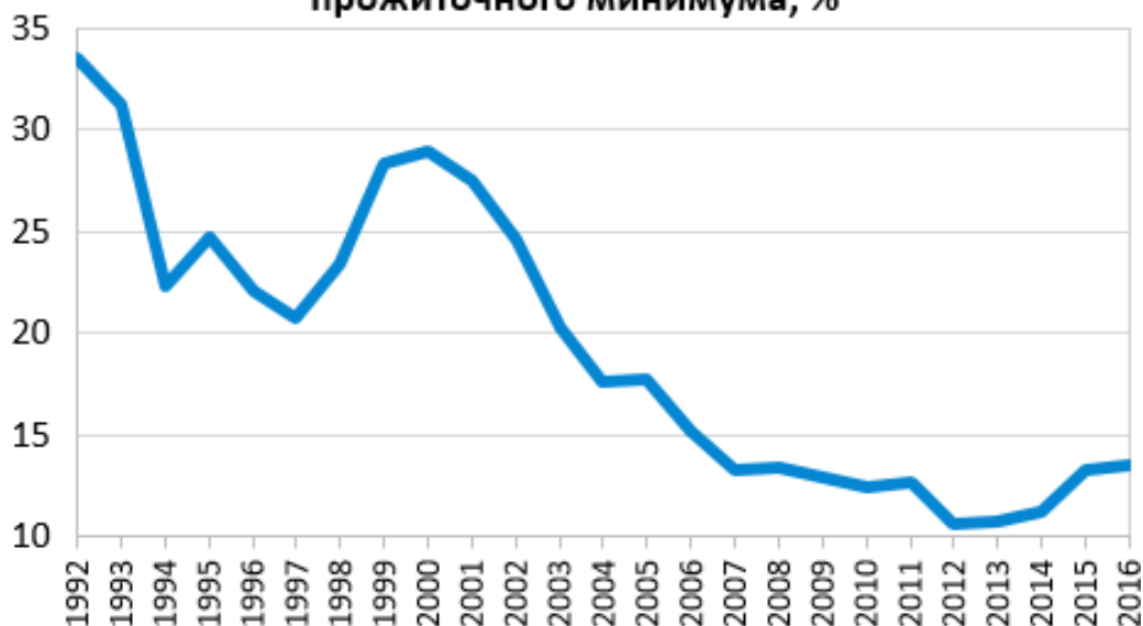
Доля населения России с доходами ниже прожиточного минимума, %