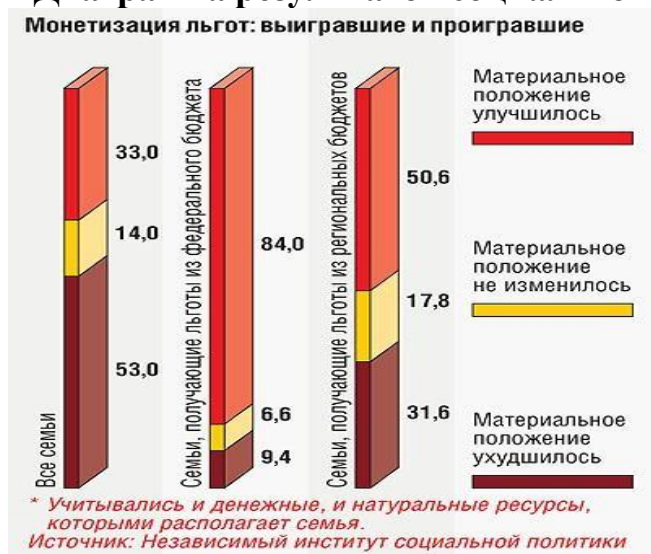
Диаграмма результатов социальной реформы монетизации льгот.

Единственный гол на 57-й минуте забивает японский нападающий Дзюньити Инамото. Ближе к концу матча, понимая, что российская сборная проигрывает, болельщики начинают бросать в экран бутылки. Милиция попытается вмешаться — и только спровоцирует толпу. Начинается бойня. Толпа бьет витрины, переворачивает и поджигает машины, ОМОНу удается подавить беспорядки только к вечеру: 79 пострадавших, двое погибают — подростки 16 и 17 лет, оба — от ножевых ранений. По официальным данным, в центре Москвы уничтожено 36 магазинных витрин, несколько троллейбусов, 107 автомобилей. После погрома — самого массового в новейшей истории страны — Госдума принимает закон об экстремизме, который прежде критиковали за ущемление свободы граждан.