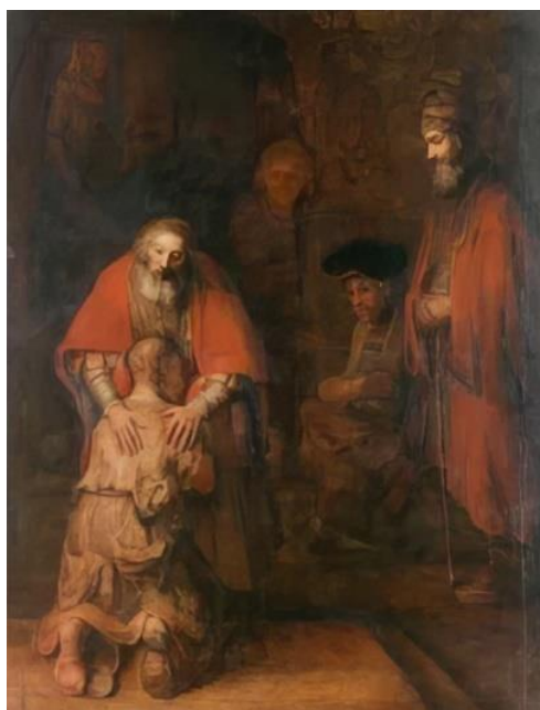
Рис. 7. «Возвращение блудного сына». Рембрандт Харменс ван Рейн