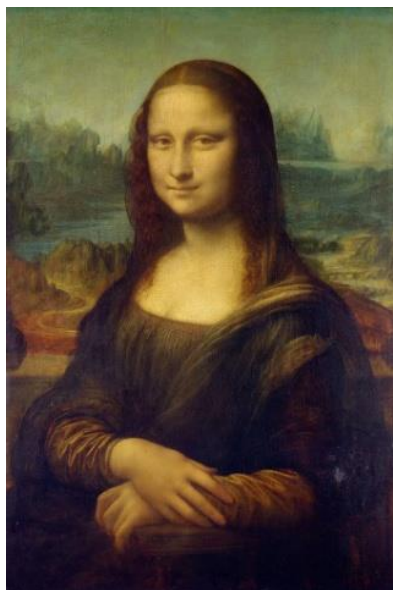
Рис. 6. «Мона Лиза» («Портрет госпожи Лизы дель Джокондо»). Леонардо да Винчи.

Приложение 2. Произведения культуры, которые могут быть предложены учащимся в рамках задания «Оживи картину».