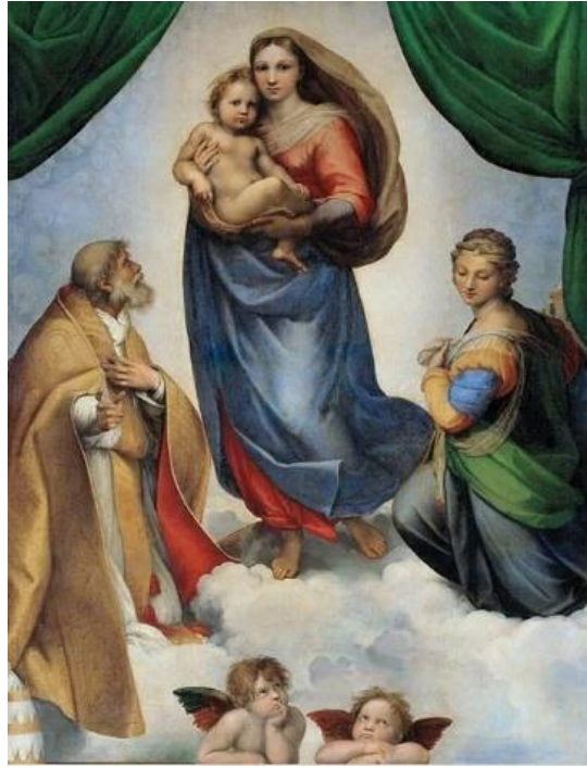
Рис. 8. «Сикстинская Мадонна». Рафаэль Санти.