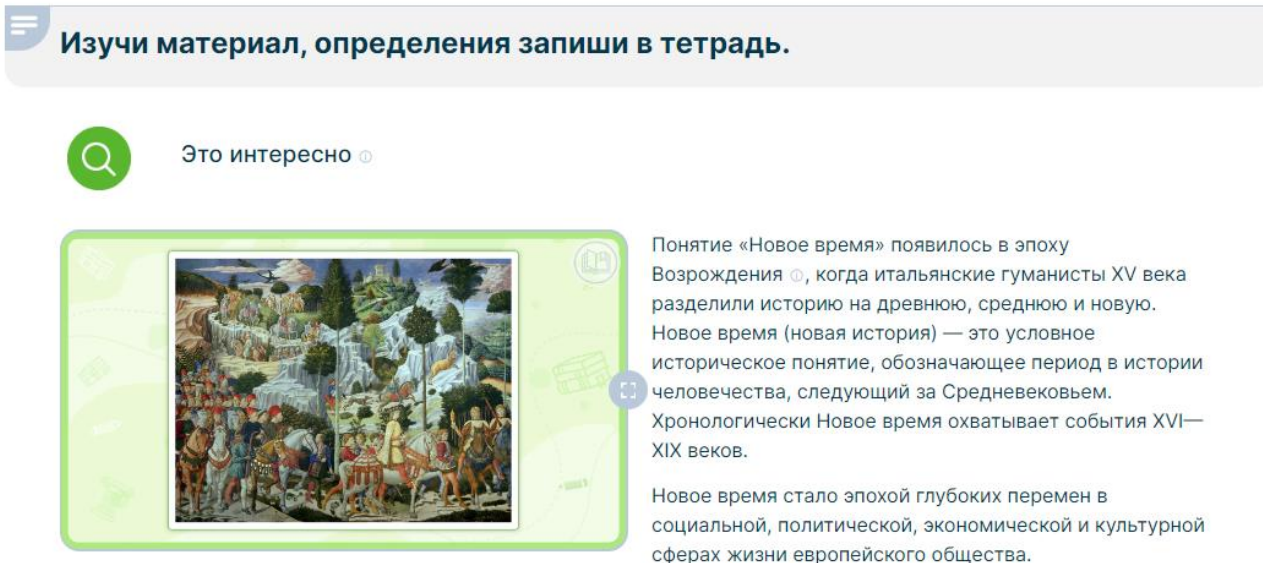
Рис. 1. Фрагмент интерактивной статьи по теме: «Новое время»

Материалы к урокам всеобщей истории в 7 классе подготовлены на базе учебно-методического комплекса по Всеобщей истории (истории Нового времени) для 7 класса авторов Юдовской А.Я., Баранова П.А., Ванюшкиной Л.М. под редакцией Искендерова А.А