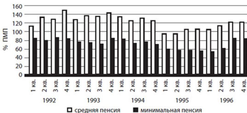
Рис. 2. Минимальный и средний размеры пенсий в РФ в сер. 1990-х гг.

Работа пенсионной системы была восстановлена уже на первом этапе работы ПФР (в 1991–1994 гг.). Вопреки многочисленным трудностям, работу пенсионного фонда удалось стабилизировать. После того как в 1993 году пенсии реально выросли, на первое место по бедности вышли неполные семьи с детьми и полные многодетные семьи (с тремя или более детьми) 33 . В 1993–1994 годов рост пенсий опережал рост зарплат, а средняя пенсия была выше прожиточного минимума пенсионера. (рис. 2). Плохо лишь, что в абсолютном выражении размер всех пенсий был невелик, как и прожиточный минимум пенсионера. Их повышение никак не успевало за инфляцией.