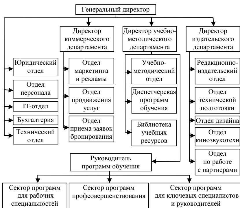
Рисунок 4. – Организационная структура «Терра-ПРОФИ»

Проведенные исследования и пробные продажи показали, что журнал может выходить тиражом до 15 тысяч экземпляров.