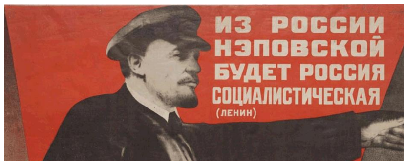
Рис. 1. Г.Г. Клуцис. Из России нэповской будет Россия социалистическая.