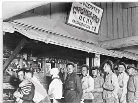
Магазин. 1920-е гг.

«Окна разинув, стоят магазины. В окнах продукты: вина, фрукты... Сыры не засижены. Лампы сияют. „Цены снижены!“». (В. Маяковский)