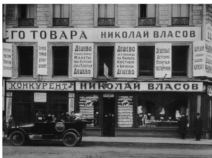
Рис. 2. Фотография, автор неизвестен. 1924 год