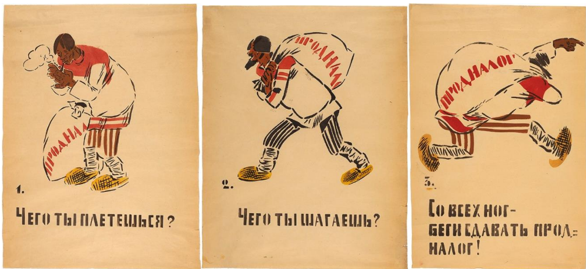
Рис. 11. М.М. Черемных. Чего ты плетешься? 1922 г.