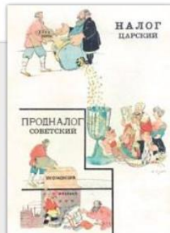
Плакат «Налог царский. Продналог советский». Художник А. Занятов. 1921 г.

Какие социально-экономические последствия имел нэп?