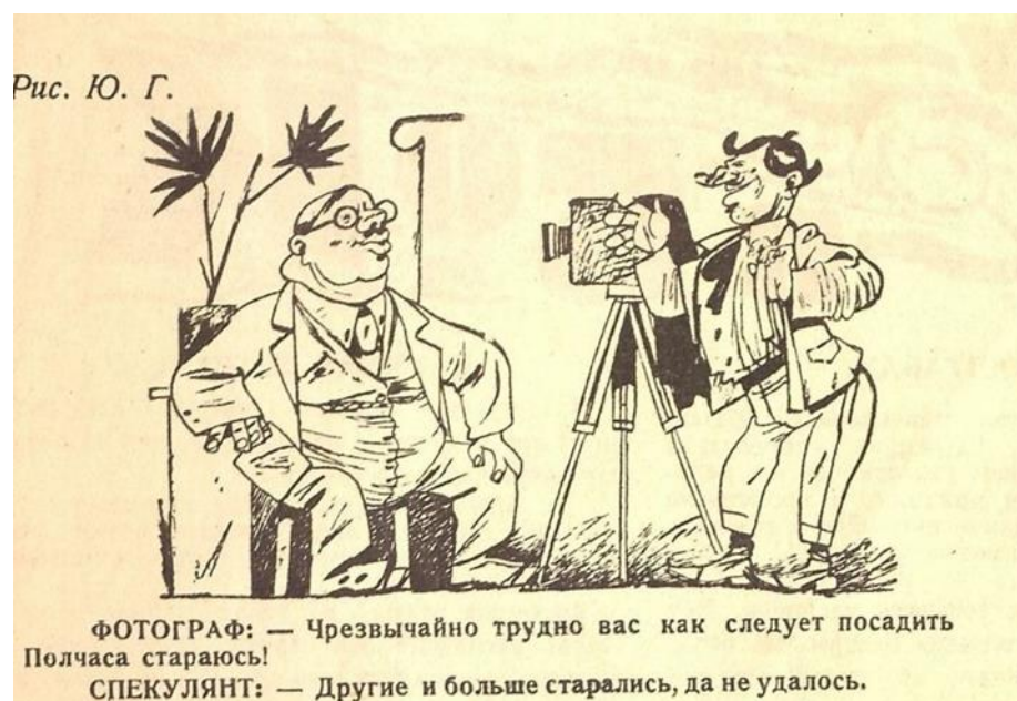
Рис. 10. Карикатура из журнала «Крокодил» №11. 1926 г.

– Как вы думаете, что отражает данная карикатура? – 200 баллов