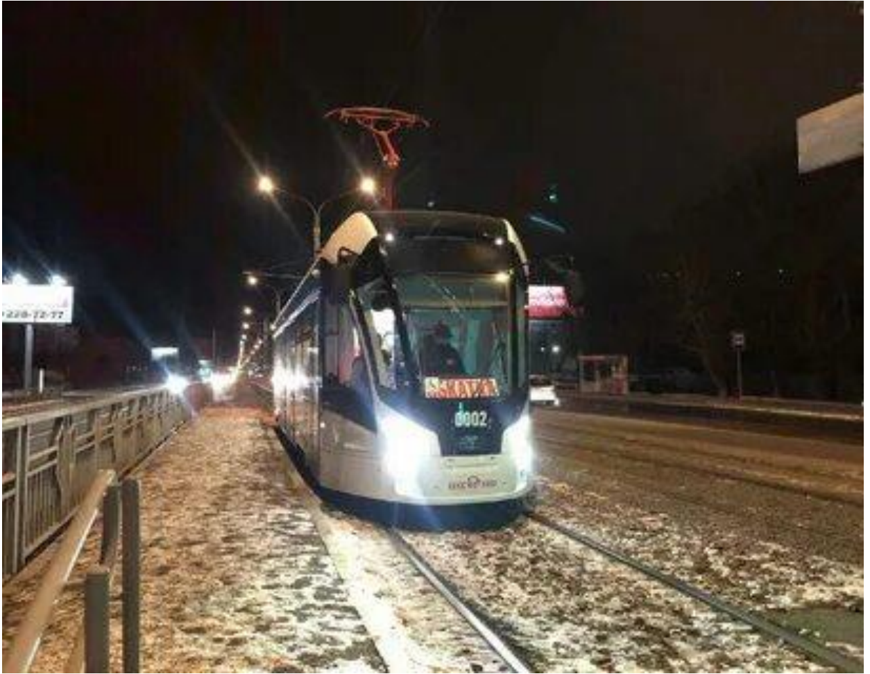
Рисунок 8. Новые трамваи «Львенок» — экологически чистый электротранспорт Красноярска

Загрязнение поверхностных и грунтовых вод, а также почв, в Красноярском крае. Самое необходимое действие в данном вопросе строгий контроль за предприятиями. При этом контроль должен осуществляться на нескольких уровнях: