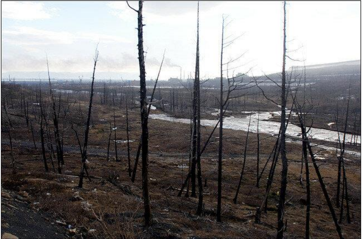
Рисунок 2. Хвойный лес в районе Норильска (сентябрь 2021 г.)

Очень сильно проблема загрязнения воздуха в Норильске встает в безветренную погоду, когда город накрывает смог.