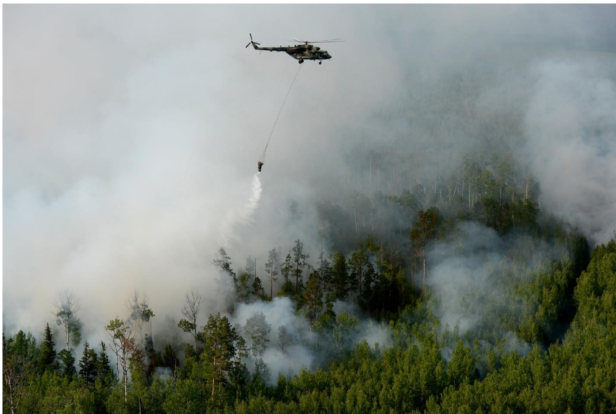
Рисунок 7. Армейская авиация тушит лесные пожары в Богучанском районе Красноярского края, лето 2019 года.

территории Красноярского края и в соседних Иркутской и Братской областях, а также в Забайкальском крае (рисунок 7).