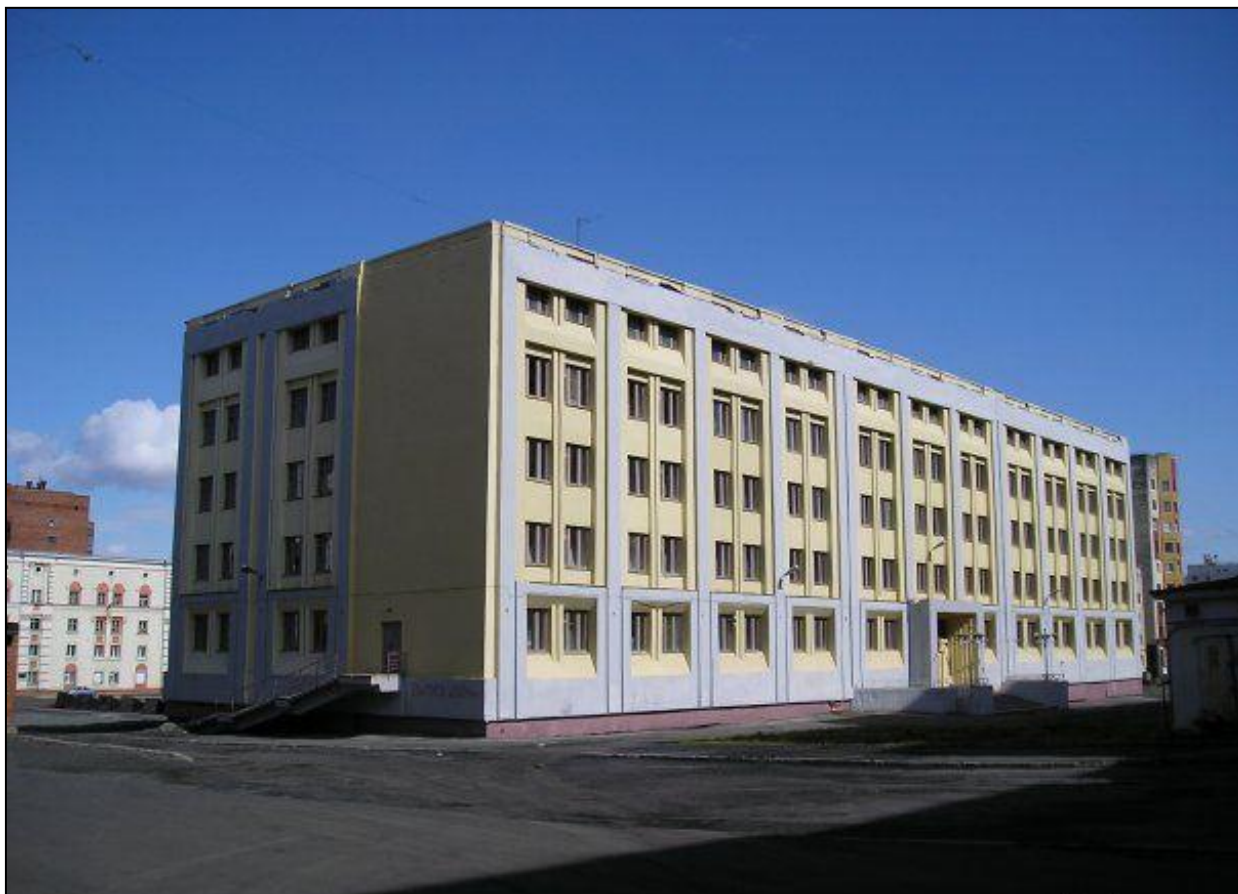
Рисунок 11. Муниципальное бюджетное общеобразовательное учреждение «Средняя школа № 1 с углубленным изучением физики и математики им. А. П. Завенягина», г. Норильска, Красноярского края

Изучение экологических проблем родного края в Муниципальном бюджетном общеобразовательном учреждении «Средняя школа № 1 с углубленным изучением физики и математики им. А. П. Завенягина», г. Норильска, Красноярского края (рисунок 11).