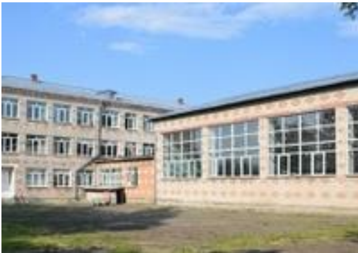
Рисунок 13. Муниципальное казенное общеобразовательное учреждение «Большемуртинская средняя общеобразовательная школа № 2», пгт Большая Мурта, Красноярского края

Для интерпретации и анализа результатов эксперимента, в качестве контрольной группы, нами был взят 6 класс МКОУ «Большемуртинская средняя общеобразовательная школа № 2», пгт Большая Мурта, Красноярского края (рисунок 13), т. е. класс из другой школы, также расположенной в этом населенном пункте (далее — контрольный класс). В 6 классе на начало эксперимента было 18 учащихся (8 мальчиков и 10 девочек).