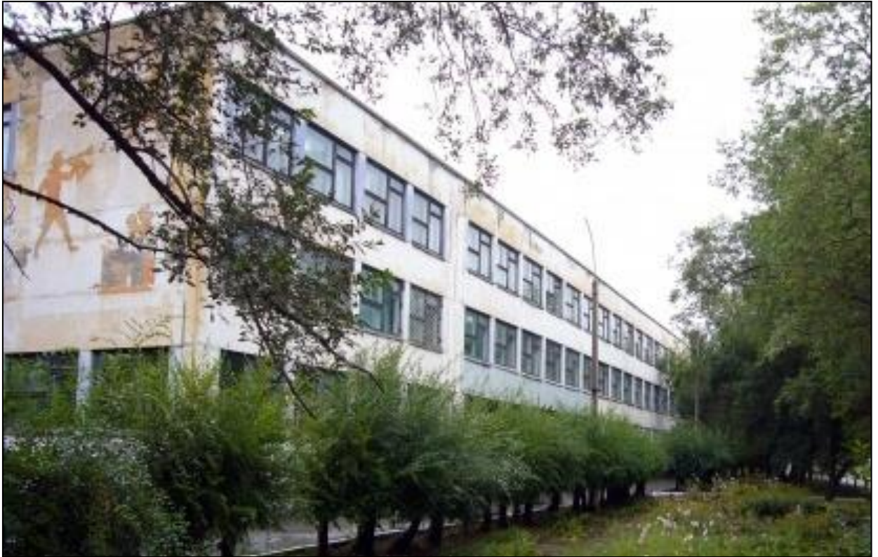
Рисунок 10. Муниципальное общеобразовательное бюджетное учреждение «Средняя общеобразовательная школа № 2», город Минусинск, Красноярского края

Педагоги данной школы, считают, что содержание экологического образования в целом, и как его составная часть изучение проблем родного края, имеют довольно сложный и многогранный состав.