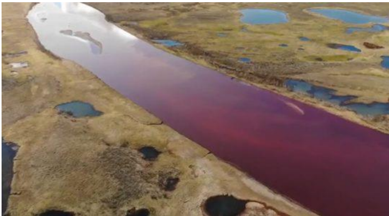
Рисунок 6. Разлив топлива с ТЭЦ-3 в Норильске в мае 2020 года

В непосредственной близости Норильска протекает река Амбарная. Она находится в ужасающем состоянии из-за случившейся экологической катастрофы — разлива нефтепродуктов с ТЭЦ-329 мая 2020 г. (рисунок 6).