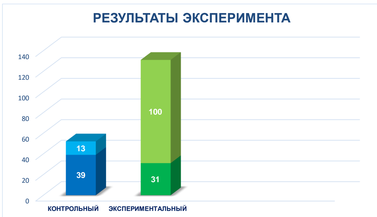
Рисунок 16. Результаты анкетирования после проведения эксперимента

Второе анкетирование показало положительную динамику ответов учащихся 7 класса обеих групп (рисунок 15).