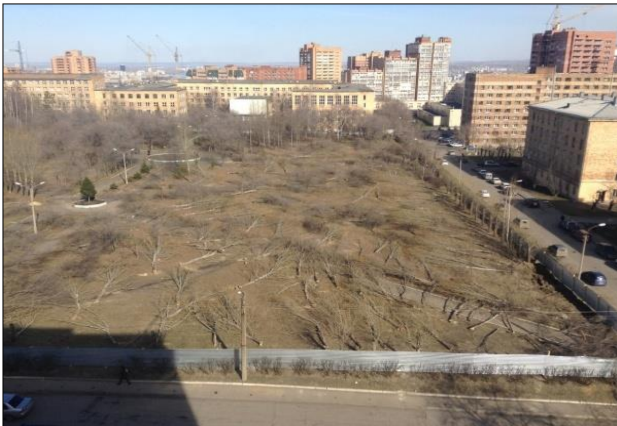
Рисунок 5. Вырубленный за одни сутки сквер в Красноярском Студенческом городке.

Серьезной экологической проблемой краевого центра является малое число зеленых насаждений во многих жилых районах города. Так же вызывает беспокойство вырубка деревьев в черте города. Стоит упомянуть вырубку сквера в Студенческом городке (рисунок 5).