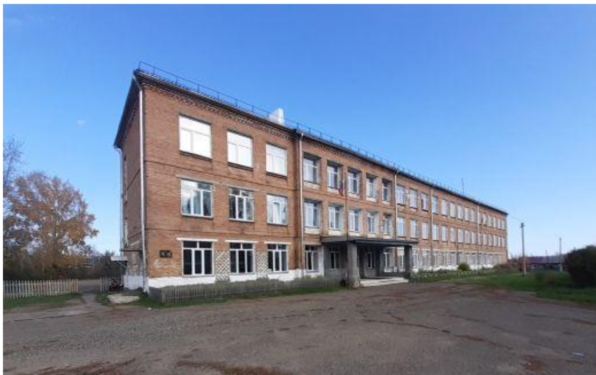
Рисунок 12. Муниципальное казенное общеобразовательное учреждение «Большемуртинская средняя общеобразовательная школа № 1», пгт Большая Мурта, Красноярского края

Эксперимент проводился во время прохождения педагогической практики в 2021–2022 на базе 6-го и 2022–2023 учебных годах на базе 7-го класса. Результаты эксперимента послужили основой для данной магистерской диссертации.