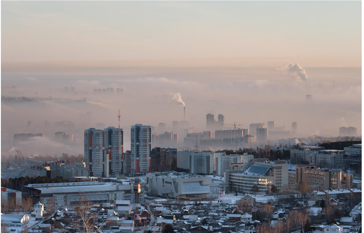
Рисунок 1. Смог над Красноярском (январь 2021 г.)

Согласно проводимым экологическим исследованиям, краевая столица традиционно входит в число городов с очень сильно загрязненной атмосферой. Во многом это объясняется индустриальным характером города, наличием металлургических заводов (КрАЗ, КрАМЗ) и предприятий теплоэнергетического комплекса.