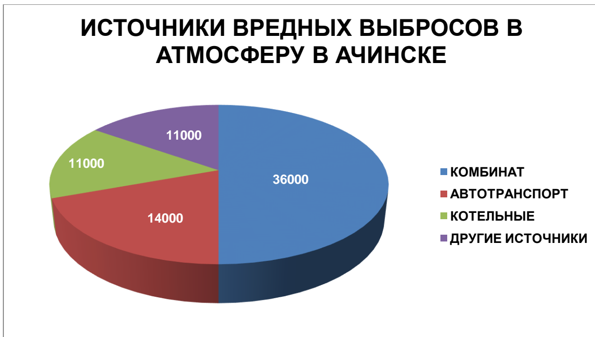
Рисунок 3. Источники вредных выбросов в атмосферу в Ачинске

Соотношение источников вредных выбросов показано на диаграмме (рисунок 3).