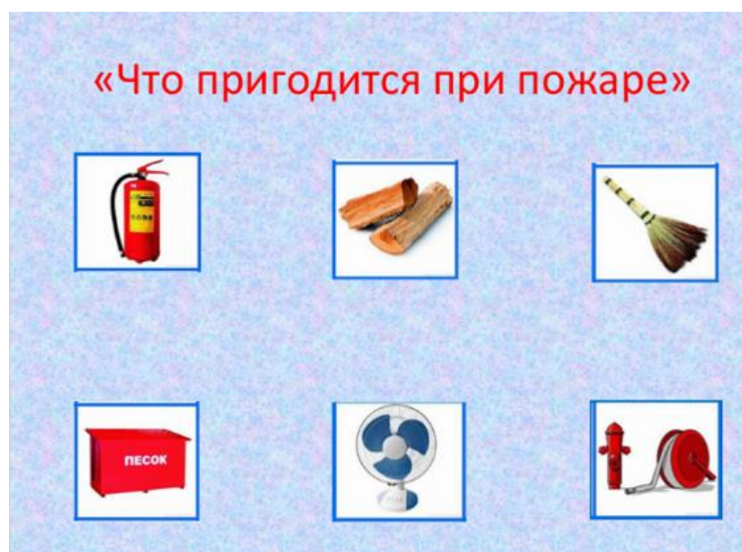
Рис.4. Интерфейс комплексной электронно - дидактической игры «Безопасность дома» – Игра 1 «Что пригодится при пожаре»