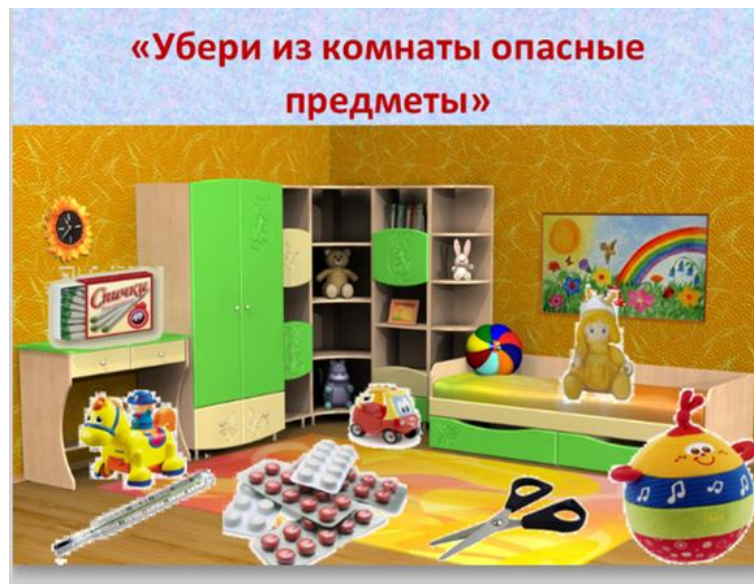
Рис.6. Интерфейс комплексной электронно - дидактической игры «Безопасность дома» – Игра 3 «Убери из комнаты опасные предметы»