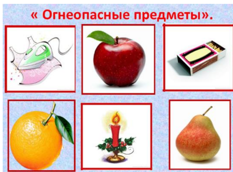
Рис.5. Интерфейс комплексной электронно - дидактической игры «Безопасность дома» – Игра 2 «Огнеопасные предметы»