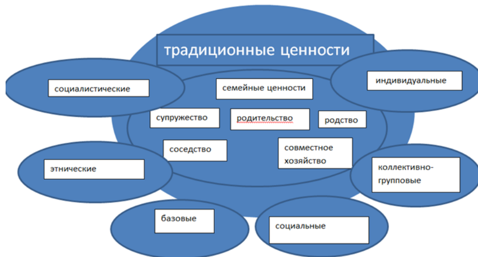
Рисунок 1 – Модель концептосферы феномена «семейные ценности» в китайской науке.

В результате применения методов сравнения, абстрагирования, аналогии, обобщения и классификации была определена концептосфера феномена «семейные ценности» в китайской науке. (Рисунок1)