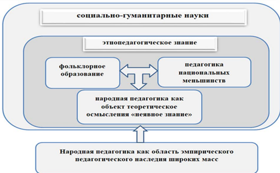
Рисунок 2 – Модель структуры этнопедагогического знания в КНР