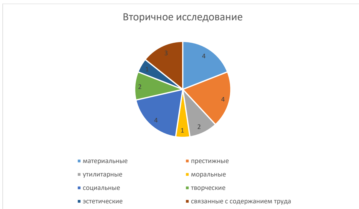
Рисунок 2 – вторичное исследование