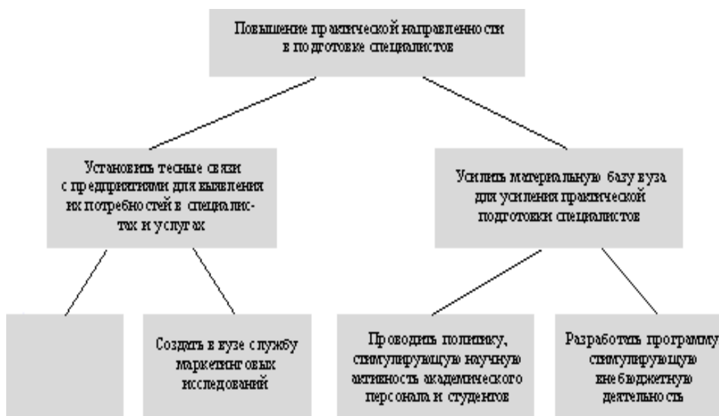
Рис. Дерево целей

Схема Исикава позволила вам сформулировать одну из проблем и попытаться представить ее причины. Теперь попытайтесь (сформулировав проблему и причины) представить дерево целей работы над проблемой. Ниже приведен пример как это можно сделать.