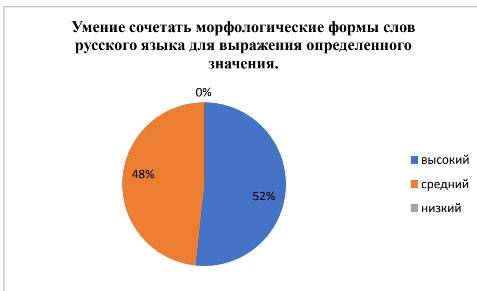
Рис. 2. Результаты исследования уровня сформированности умения сочетать морфологические формы слов русского языка для выражения определенного значения.

22% учащихся находятся на низком уровне. Это свидетельствует о том, что учащиеся верно составили менее 5 словосочетаний.