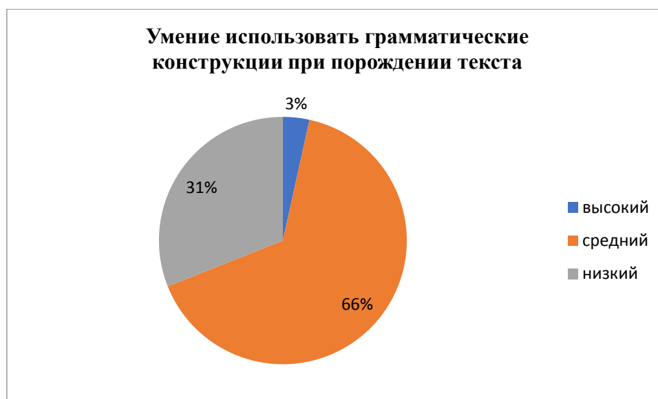
Рис. 3. Результаты исследования уровня сформированности умения использовать грамматические конструкции при порождении текст.

0% учащихся находятся на низком уровне. Это означает, что учащиеся не испытывают трудности в употреблении верной предложно-падежной формы слов при составлении словосочетаний.