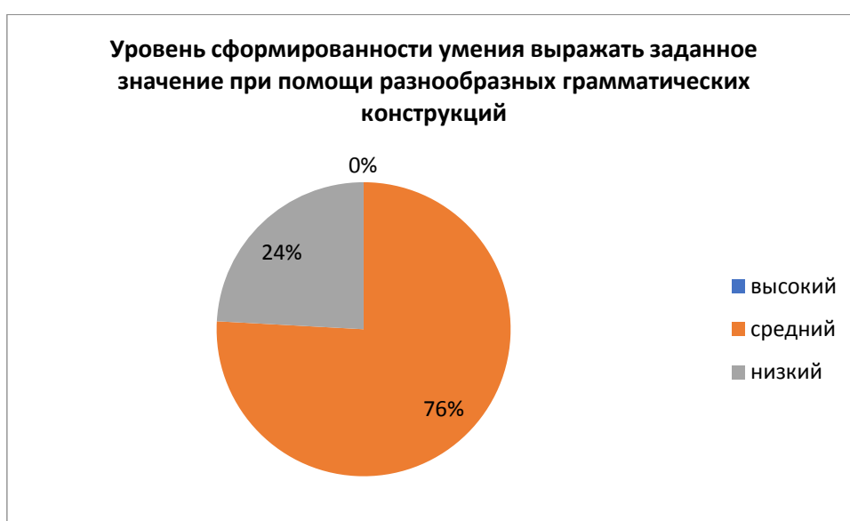
Рис. 1. Результаты исследования сформированности умений выражать заданное значение с помощью определенной грамматической конструкции.

Частота встречаемости определенных критериев приведена в диаграммах. В них указаны уровни сформированности и частота встречаемости.