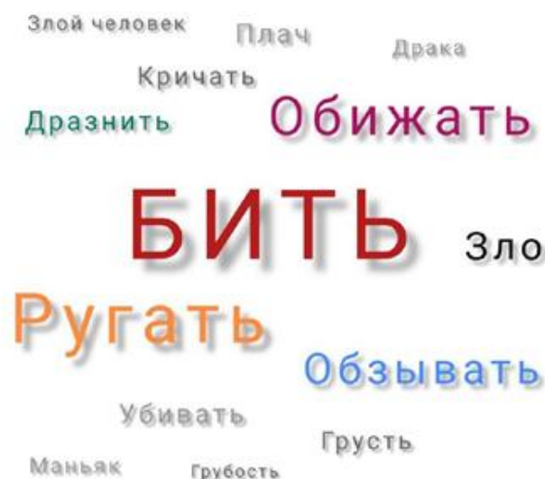
Рисунок 1 - Результаты обработки метода свободных ассоциаций

Получены ассоциации детей в письменном виде.