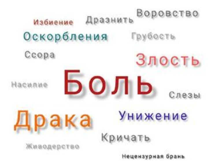
Рисунок 2 - Результаты обработки метода свободных ассоциаций

Получены ассоциации детей в письменном виде.