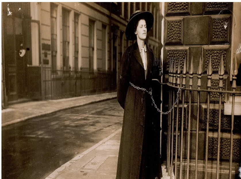
Фото ареста Эммелины Панкхерст у Букингемского дворца, 1914 г.