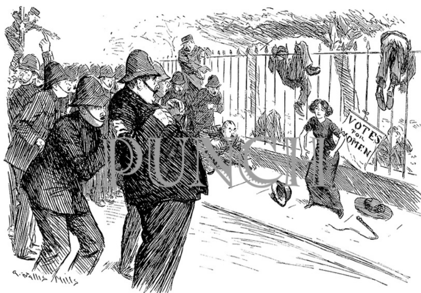
THE SUFFRAGETTE THAT KNEW JIU-JITSU. THE ARREST.