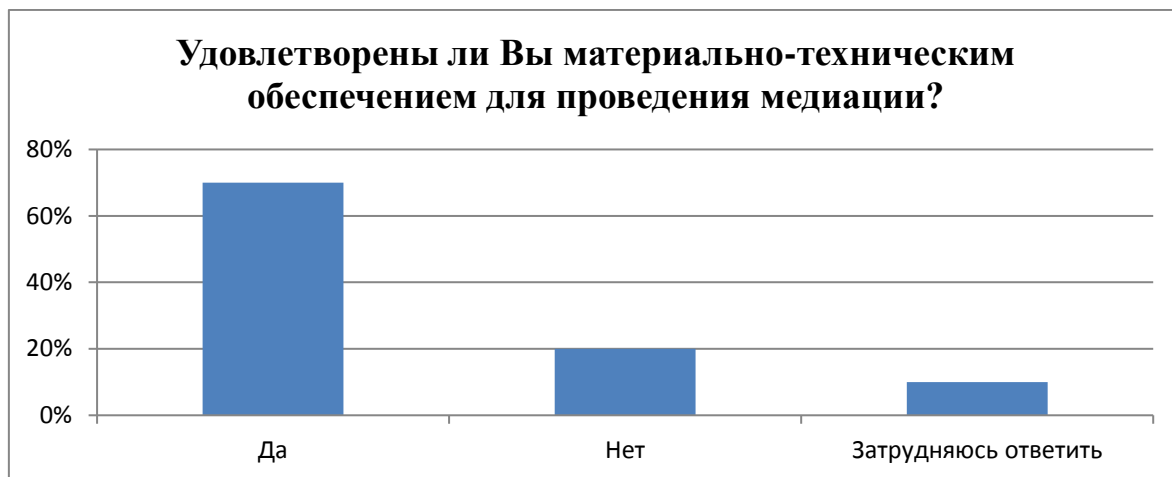
Рис. 5. «Оснащенность техническими средствами при проведении медиации».

Три человека заметили, что оснащение должно быть «посвежее», посовременнее, один воздержался, а 15 заявило, что оснащение было на должном уровне.