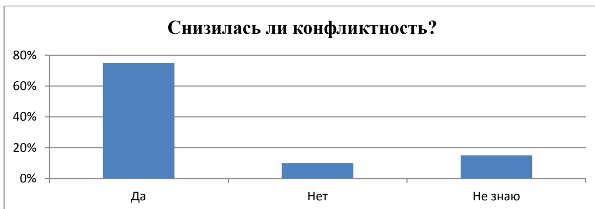
Рис. 1. «Уровень агрессии участников медиаций».

У большинства участников медиации уровень агрессии снизился. Один отметил, что осталась на прежнем уровне, двое – не определились.