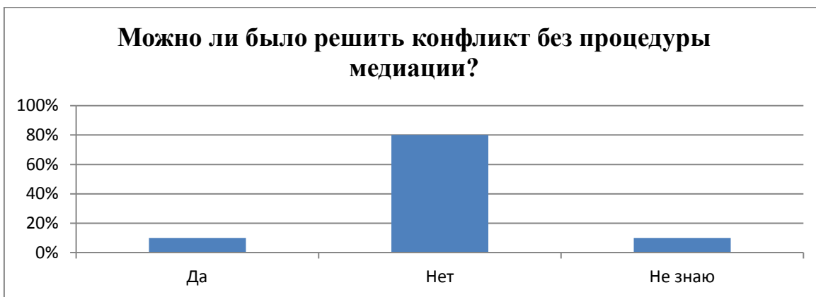
Рис. 2. «Обоснованность сеансов медиации в решении конфликтов».

Только два человека отметили в анкете, что можно было бы обойтись без медиации, все остальные – отметили ее несомненные плюсы.