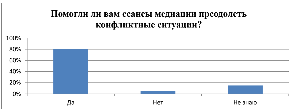
Рис. 3. «Полезность проведенной школьной службой медиации».

3. Помогли ли вам сеансы медиации преодолеть конфликтные ситуации?