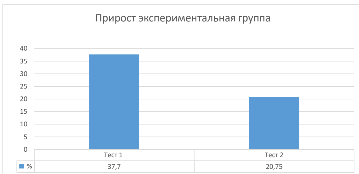
(Рис. 3). Диаграмма 3. - – Прирост результатов в экспериментальной группе

Оценивая прирост результатов после проведения педагогического эксперимента в экспериментальной группе нами, были сделаны следующие выводы. Уровень умение общаться и взаимодействовать с партнёрами по совместной деятельности или обмену информацией вырос на 37,7 %, способность действовать с учётом позиции другого и уметь согласовывать свои действия вырос на 20,27 %.