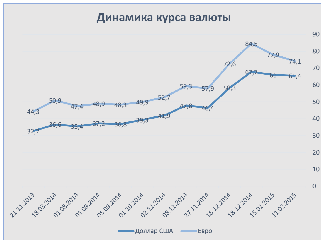
Таблица 1 – «Сравнение курса валют»