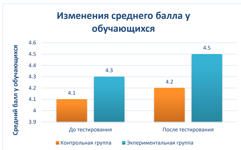
Рисунок 5 – «Изменение среднего балла у обучающихся»

формировать функциональную грамотность и получать необходимые навыки для пользования финансовыми услугами в повседневной жизни. Немаловажный качественный фактор – удовлетворенность обучением. Данный показатель подразумевает под собой то, на сколько обучающимся был интерес формат урока и на сколько они были заинтересованы. У обучающихся контрольной группы, где был проведен традиционный урок в форме лекции удовлетворенность процессом обучения составила 35%, что на 38% меньше, чем у экспериментальной группы, где данный показатель составил 73% от общего числа обучающихся.