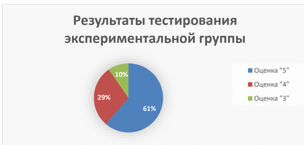
Рисунок 3 – «Результаты тестирования экспериментальной группы»

В экспериментальной группе, где был использован комплекс самостоятельных заданий, результаты тестирования улучшились по отношению к контрольной группе. Оценку «4» получило лишь 29% обучающихся, что выше на 23% чем у контрольной, а оценку «3» получило 10%, что ниже на 9% по отношению к контрольной группе.