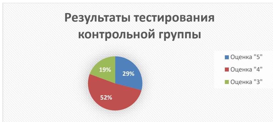
Рисунок 2 – «Результаты тестирования контрольной группы»

В экспериментальной группе, где был использован комплекс самостоятельных заданий, результаты тестирования улучшились по отношению к контрольной группе. Оценку «4» получило лишь 29% обучающихся, что выше на 23% чем у контрольной, а оценку «3» получило 10%, что ниже на 9% по отношению к контрольной группе.