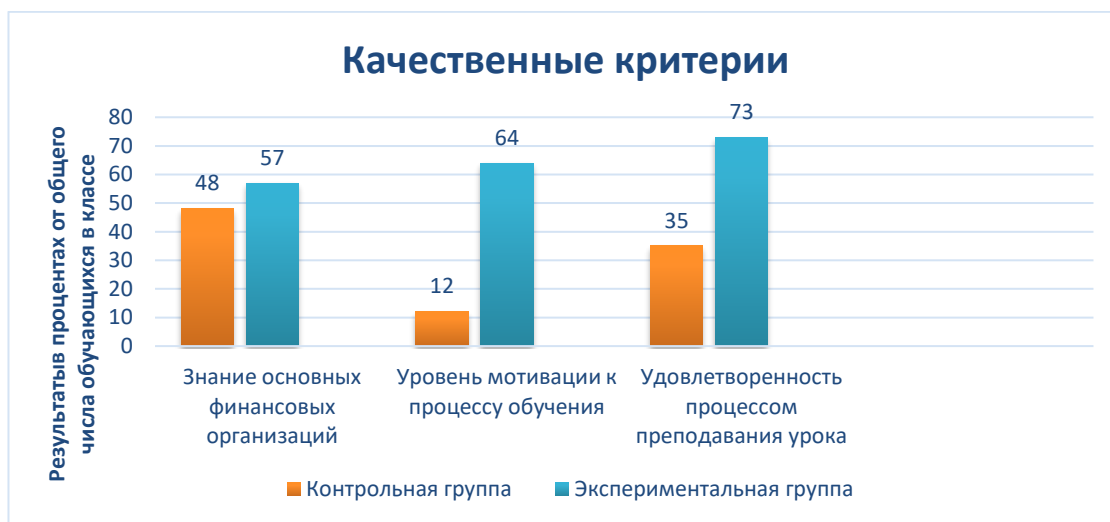
Рисунок 4 – «Качественные критерии»

Для того, чтобы лучше выявить результативность применения самостоятельных заданий в образовательном процессе, был проведен анализ качественных и количественных критериев оценки результативности, который был предложен ранее.