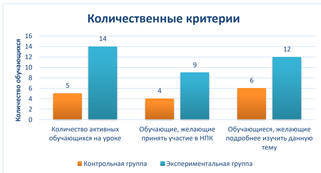
Рисунок 6 – «Количественные критерии»

Рассмотрим результаты количественных критериев. На рисунке 6 можно увидеть, что количество активных обучающихся на уроке выросло почти в 3 раза в экспериментальной группе по сравнению с контрольной, что является самым ярким изменением. Формат практической работы дал возможность обучающимся принять активное участие в образовательном процессе, проявить себя на уроке (ситуация успеха), выступить со своим решением перед аудиторией. Увеличилось в 2 раза количество обучающихся, желающих принять участие в научно-практической конференции и количество обучающихся, желающих изучить тему «Кредит: зачем он нужен и где его получить». Это свидетельствует о том, что обучающиеся были заинтересованы в изучении и хотели бы лучше изучить для применения своих знаний в практической деятельности. Можно предположить, что при систематическом использовании на уроках комплексов самостоятельных заданий, показатели как количественные, так и качественные будут увеличиваться, а значит и повышаться уровень знаний обучающихся по данной дисциплине.