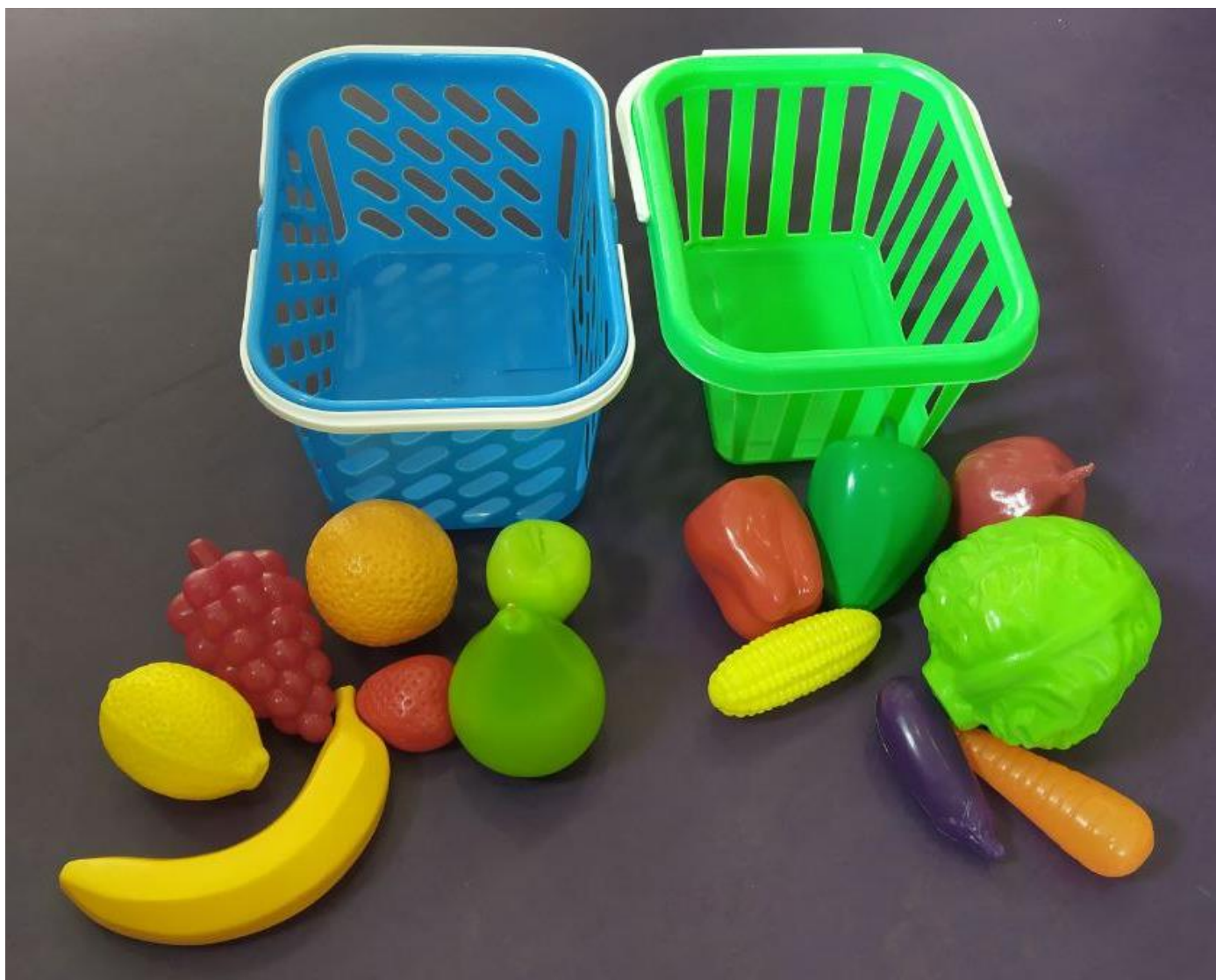
Рисунок Б1. Необходимые материалы для дидактической игры «Two baskets»