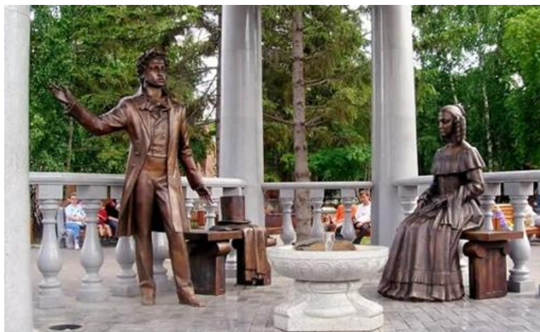
Рис. 18. Памятник А. Пушкину и его жене Н. Гончаровой в центре Красноярска