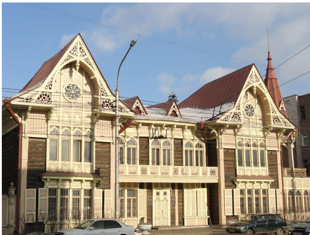
Рис. 5. Литературный музей имени В. П. Астафьева

Большинство музеев не связаны с литературой. Но в Красноярске есть уникальный литературный музей на улице Ленина. Он находится в красивом, сохранившемся особняке 19 века, на улице Ленина 66 (рис. 5).