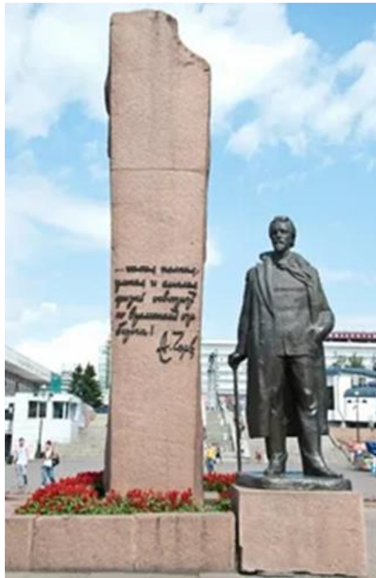
Рис. 16. Памятник русскому писателю А. Чехову на набережной Енисея

Поэт Владимир Маяковский точно никогда не был в Красноярске. А памятник ему находится на правом берегу Красноярска, на проспекте Красноярский Рабочий, построен в 1957 году. (рис. 17).