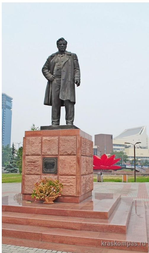
Рис. 14. Памятник В.П. Астафьеву в Красноярске

архитектор Арэг Демирханов. Право открыть памятник предоставили сыну писателя Андрею и внукам Виктору и Полине [17] :