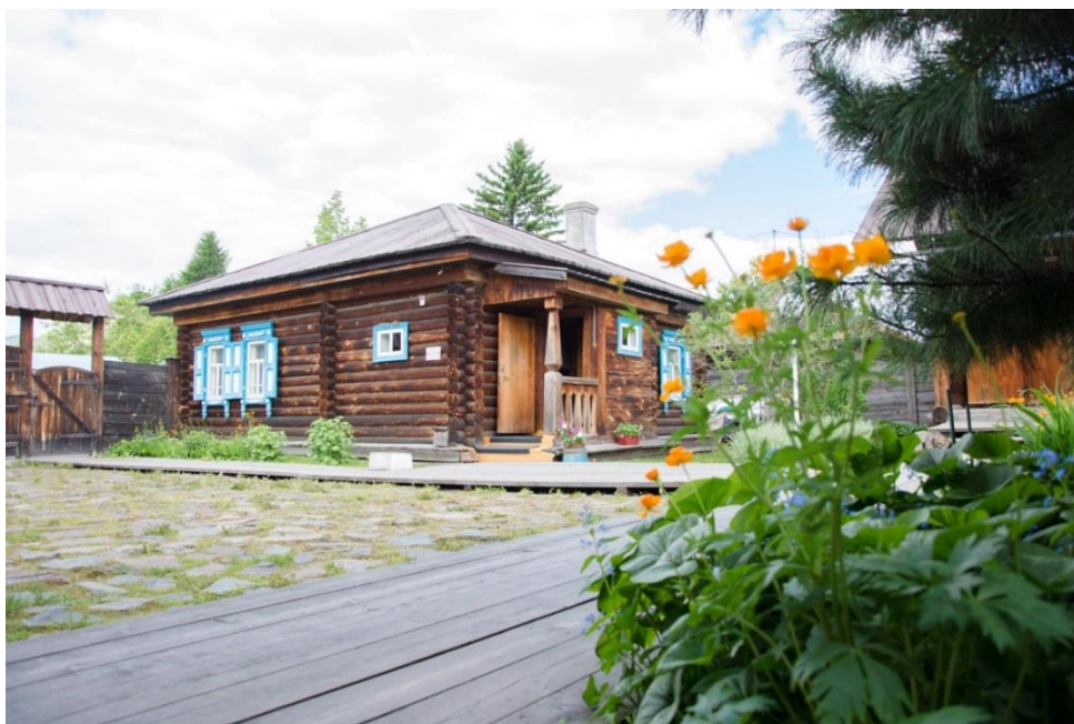
Рис. 7. Фото мемориальный комплекс Виктора Астафьева в селе Овсянка [13]

Виктор Петрович Астафьев — известный советский и российский писатель, знаменитый своими военно-патриотическими произведениями, а также повестями и рассказами о своем родном крае (рис. 8).