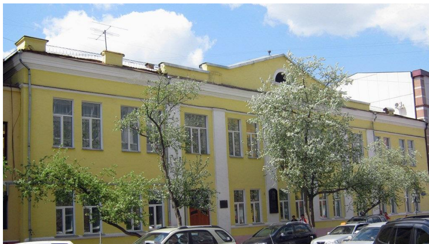
Рис. 4. Современный вид Центральной городской библиотеки имени Горького (ул. Перенсона, 23)

В 1947 г. библиотеке было присвоено имя писателя Алексея Максимовича Горького. В 1960-х годах одноэтажное здание библиотеки было перестроено - расширен первый и надстроен второй этажи. И сейчас здание выглядит вот так (рис. 4 ).