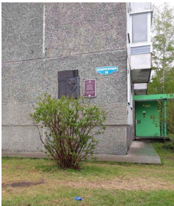
Рис. 9. Памятная доска Астафьеву на доме, где он жил в Красноярске (Академгородок, 14)

Третья доска писателю – там, где он учился. Она была установлена в 2004 году, и на ней такой текст: «В 1941-1942 гг. в фабрично-заводском училище, ныне ПУ № 19, обучался великий русский писатель Виктор Петрович Астафьев». Это улица Северо-Енисейская, 42. Это профессиональное училище теперь носит его имя [13].