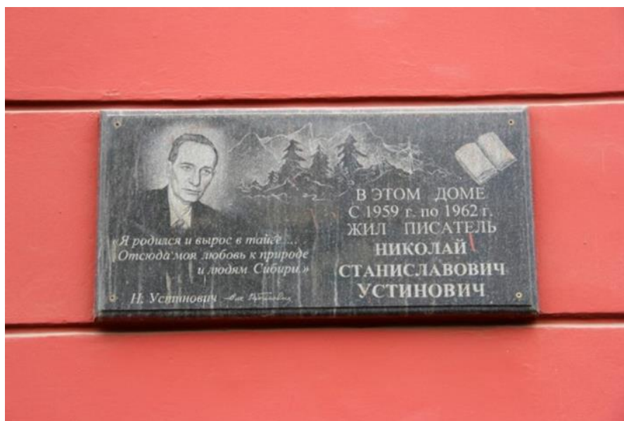
Рис. 13. Мемориальная доска писателю Николаю Устиновичу в Красноярске, где он жил [12]

Этому писателю установлены в Красноярске две памятные доски – на улице Мира 91а, где он жил в 1959-62 гг., и на ул. Устиновича 1а, т.к. улица названа его именем. Текст мемориальной доски: «Я родился и вырос в тайге... Отсюда моя любовь к природе и людям Сибири» (рис. 13).