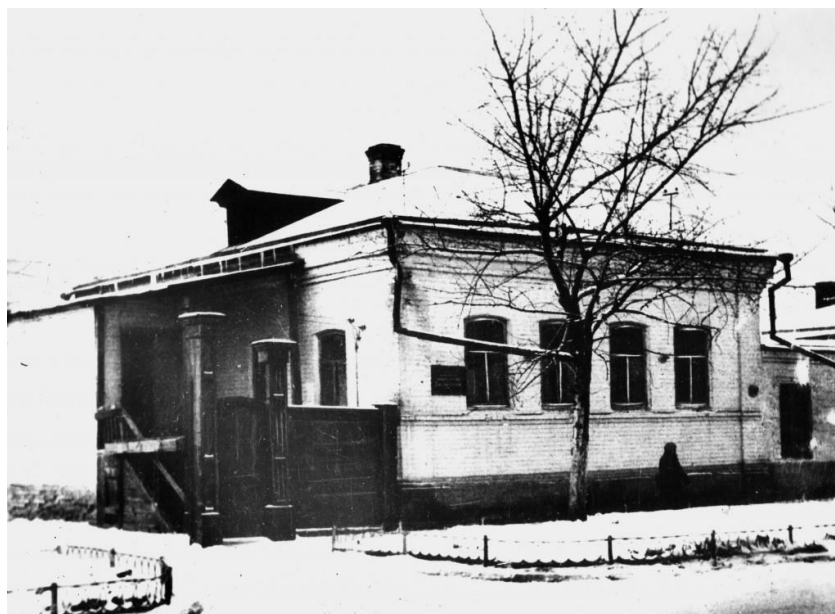
Рис. 2. Здание самой первой народной библиотеки в городе Красноярске (улица Каратанова, 11)