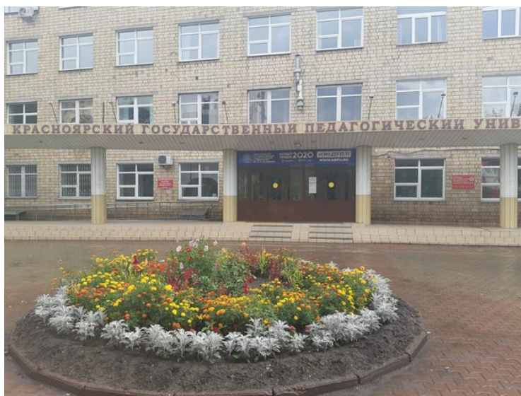
Рис. 19. КГПУ имени писателя В.П. Астафьева

Красноярский государственный педагогический университет (КГПУ) им. В.П. Астафьева (рис. 19).