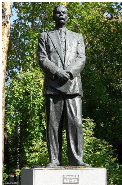
Рис. 15. Памятник М. Горькому в Красноярске

Антон Чехов был в Красноярске всего один день проездом на Сахалин в 1890 году. Памятник ему расположен на набережной Енисея, на Театральной площади (рис. 16).