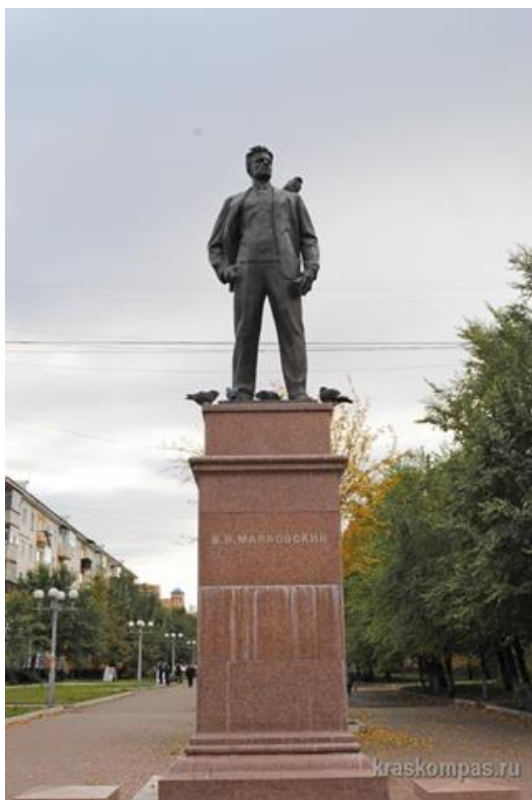
Рис. 17. Памятник поэту Маяковскому на правом берегу в Красноярске

Поэт Пушкин тоже никогда не был в Красноярске, но его именем названа улица, библиотека и театр. Памятник Александру Пушкину и его жене Наталье Гончаровой расположен в центре города, на улице Мира, рядом с драматическим театром имени Пушкина (рис. 18).