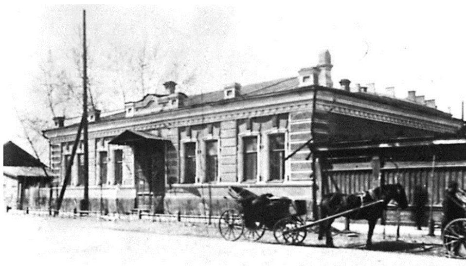
Рис. 3. Городская библиотека до реконструкции

В октябре 1900 года библиотека переехала с улицы Каратанова в собственное здание в Почтамтском переулке (ныне ул. Перенсона, 23), которое было построено на средства братьев купцов Даниловых (рис. 3)