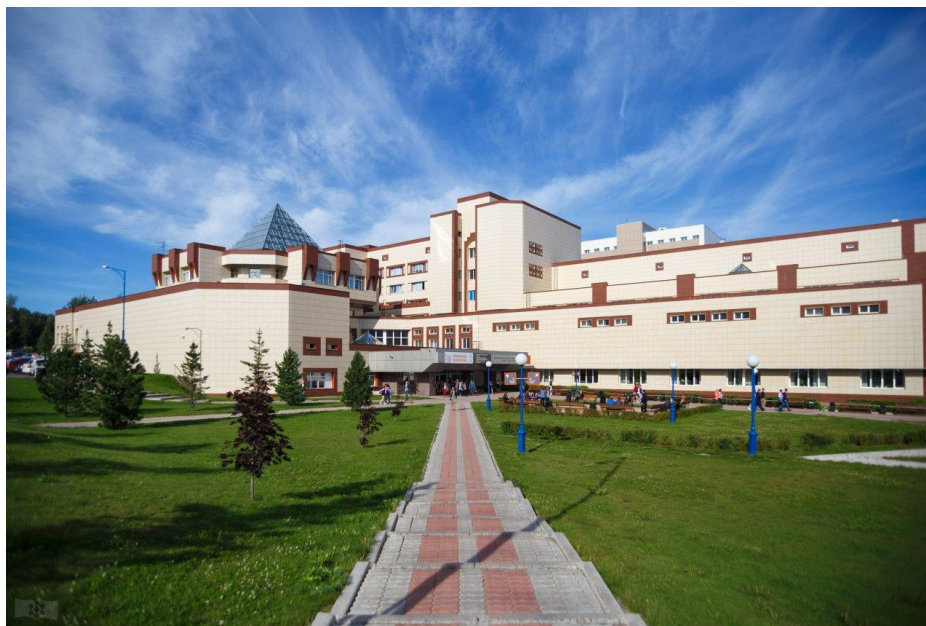
Рис. 20 Сибирский федеральный институт, и один из его институтов - ИФИЯК

Сибирский федеральный университет. Раньше он назывался КГУ, и был основан в 1963 году, назывался до 2006 года - Красноярский государственный университет (КГУ).