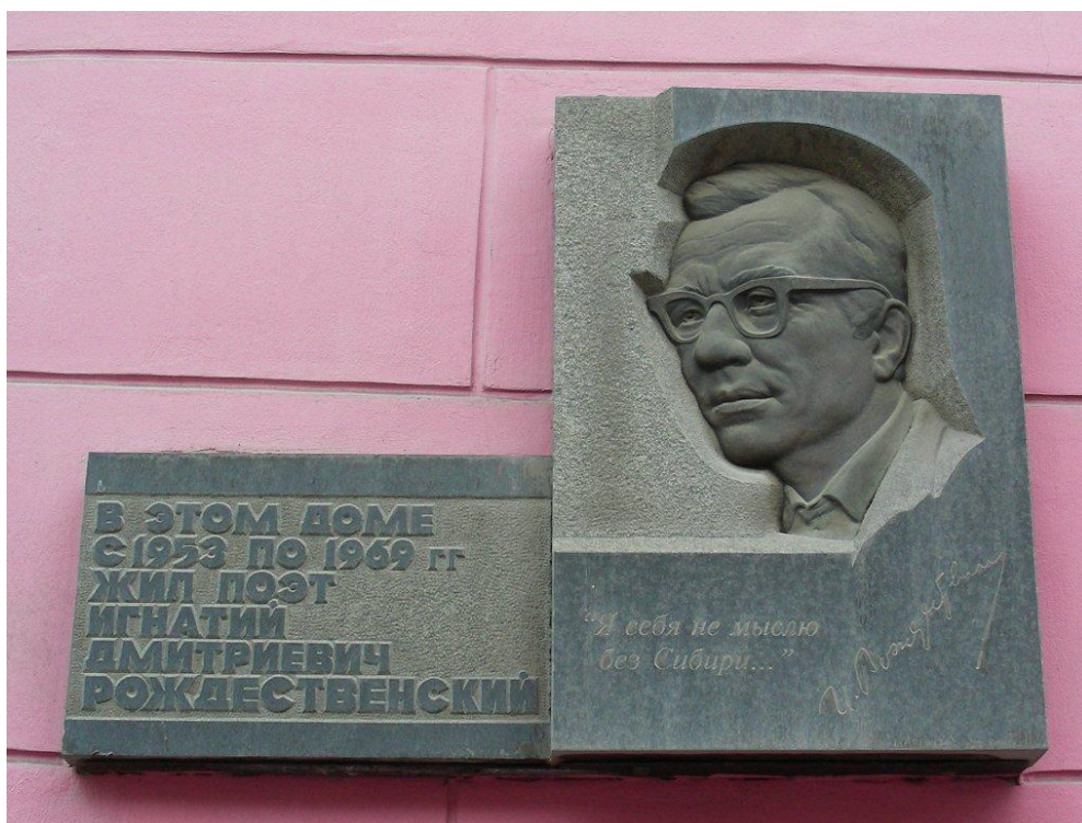
Рис. 11. Памятная доска И. Рождественскому, поэту

Последние книги Рождественского вышли в Красноярске. Похоронен на Николаевском кладбище в Красноярске. На фасаде жилого дома в Красноярске по улице Декабристов, 23, где в 1953—1969 гг. жил поэт, установлена мемориальная доска в память о нем (рис. ).