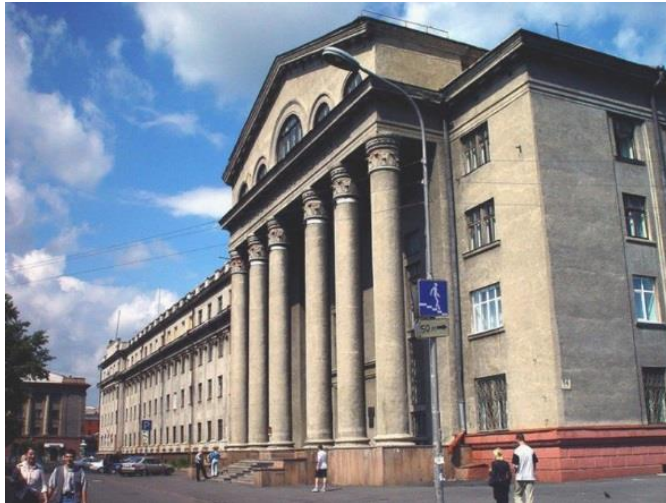
Рис. 1. Красноярская краевая научная библиотека, важнейший центр литературы в Красноярском крае

История создания Красноярской краевой библиотеки началась в июне 1935 г., когда после образования Красноярского края в 1934 г. краевой комитет ВКП(б) и крайисполком принимают решение о создании краевой публичной библиотеки. И эту библиотеку разместили в здании краевого музея, а отдельное здание библиотеки построили лишь в начале 1960-х гг.