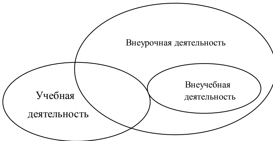
рис.1 взаимодействие различных видов деятельности.