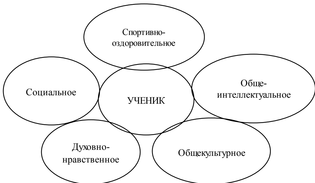
рис.2 направления развития ребенка