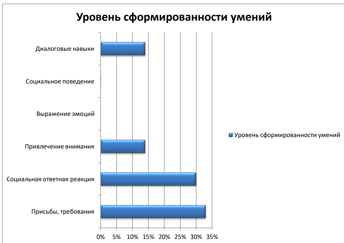
Рисунок 1 – Уровень сформированности коммуникативных умений после проведения констатирующей диагностики

Диалоговые навыки не развиты. Речь нарушена. Не умеет инициировать диалог, обращаясь к человеку по имени, не умеет инициировать диалог, используя стандартные фразы, не умеет завершить диалог, используя стандартные фразы, не умеет поддержать диалог, делаясь информацией с собеседником. Не отвечает обращенную речь.