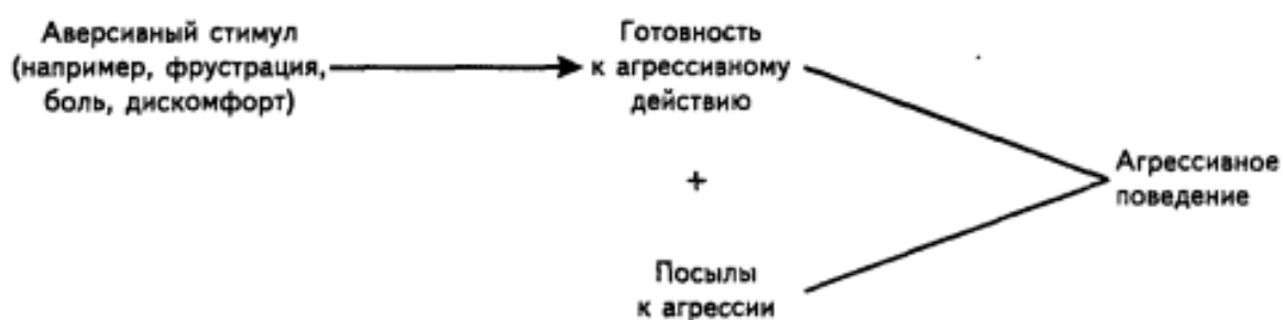
Рисунок 1. Когнитивная модель агрессивного поведения Л. Берковица

Эта относительная модель представлена на рисунке 1: