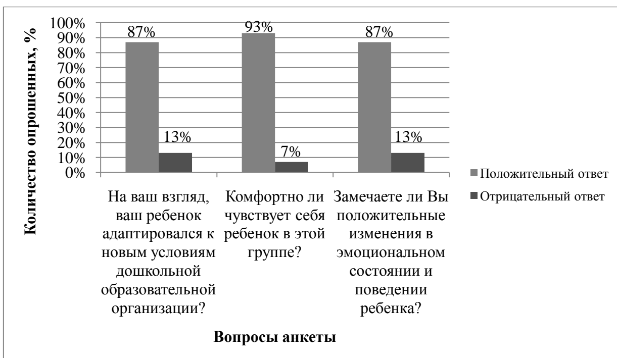
Рисунок 4. Распределение количества опрошенных родителей по оценке процесса адаптации детей раннего возраста к условиям ДОО

По результатам проведенного анкетирования 11 из 15 (73%) опрошенных родителей ответили положительно на все вопросы анкеты, исходя из этого, можно сделать вывод, что большинство родителей считают, что их ребенок адаптировался к дошкольной образовательной организации.