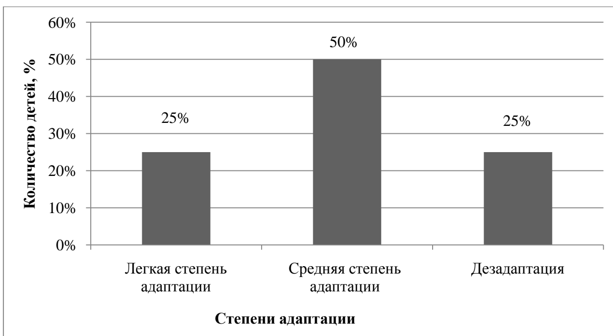
Рисунок 1. Распределение выборочной совокупности детей по степени адаптации (методика определения степени адаптации ребенка в ДОО Меркуловой В.Н., Самоходкиной Л.Г.)

Как мы видим, по результатам данной методики, детей с легкой степенью адаптации 25% (5 человек). Дети с легкой степенью адаптации без каких – либо проблем идут на контакт как со взрослыми, так и со сверстниками, с ними можно легко найти контакт. Можно не переживать за их сон и аппетит – тоже проходит без проблем. Эта группа детей легко отпускают родителей, когда те приводят их в детский садик, и с интересом включаются в игровой процесс с воспитателем и другими детьми.