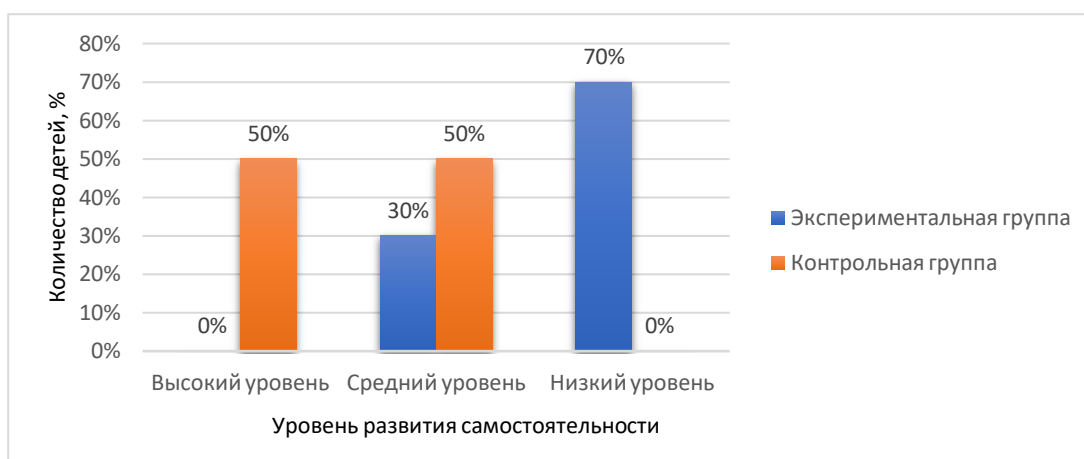
Рисунок 1. Результаты изучения развития самостоятельности детей 5-6 лет в экспериментальной и контрольной группах (констатирующий этап)

Высокий уровень развития самостоятельности отмечается у 0% детей экспериментальной группы, и у 50% детей контрольной группы. При высоком уровне развития самостоятельности, ребенок стремится к решению задач деятельности без помощи взрослых; умеет поставить цель деятельности, не опираясь на указания, при этом может найти себе занятия и организовать свою деятельность, осуществляя элементарное планирование, реализуя задуманное адекватно поставленной цели; способен к проявлению инициативы и творчества в решении возникающих задач, выполняет решение задач без напоминаний, при этом без упрямства может отстаивать свое мнение.