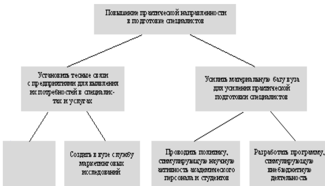
Рис. Дерево целей