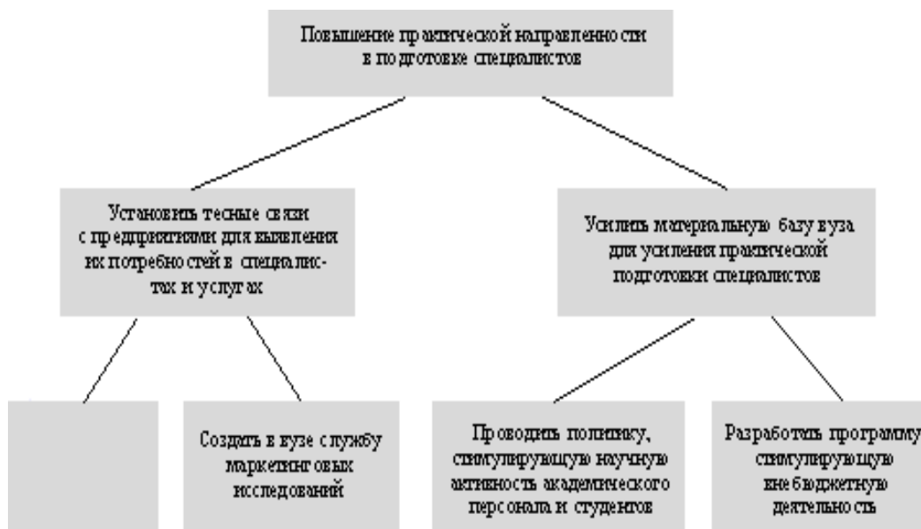
Рис. Дерево целей

Схема Исикава позволила вам сформулировать одну из проблем и попытаться представить ее причины. Теперь попытайтесь (сформулировав проблему и причины) представить дерево целей работы над проблемой. Ниже приведен пример как это можно сделать.