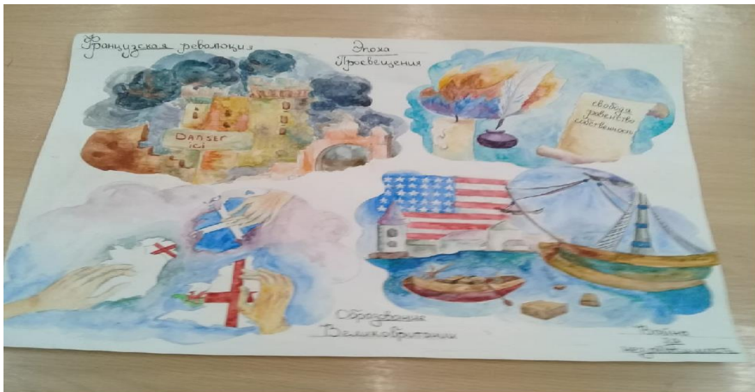
Коллаж на уроке истории 8 класс. МБОУ БСОШ 3). Обобщенный урок на тему: Великая Французская революция.