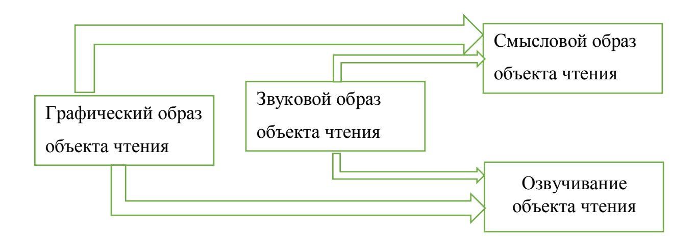
Рисунок 1 – Схема умения чтения

Итак, мы видим, что чтение нужно понимать как процесс восприятия и переработки графически зафиксированной буквенной речевой посылки, а результатом этого процесса является понимание и осмысление содержания [Очерки методики обучения..., 1977, с. 11].