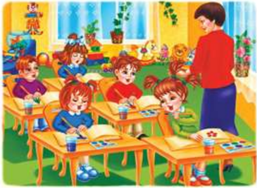
Рисунок 6 – Урок рисования (слайд 1)

Презентация с картинками на примере слова Art