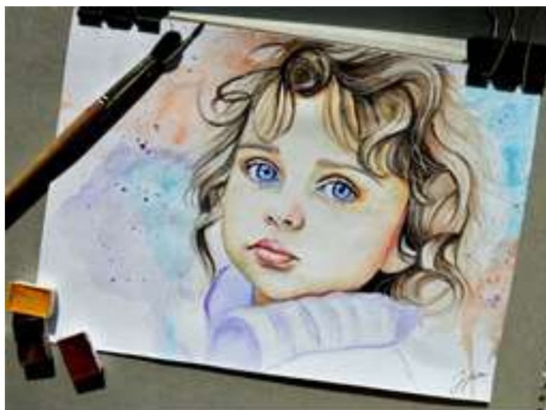
Рисунок 7 – Портрет (слайд 2)