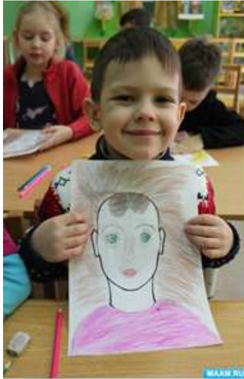
Рисунок 8 – Мальчик нарисовал портрет на уроке рисования (слайд 3)