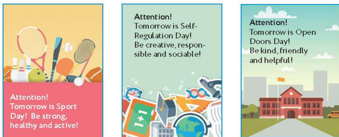
Рисунок 1 – Упражнение 122, стр 34

122 Look at the posters and guess what day will be at school tomorrow. Does your school have a similar day?