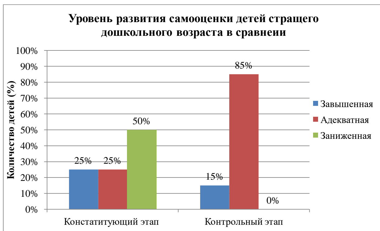
Рисунок 4. Сравнительные результаты изменения уровня развития самооценки на контрольном этапе по методике В.Г. Щур

Сравнительные результаты контрольного этапа по изучению уровня самооценки детей дошкольного возраста по методике «Лесенка» В.Г. Щур представлены на рисунке 4: