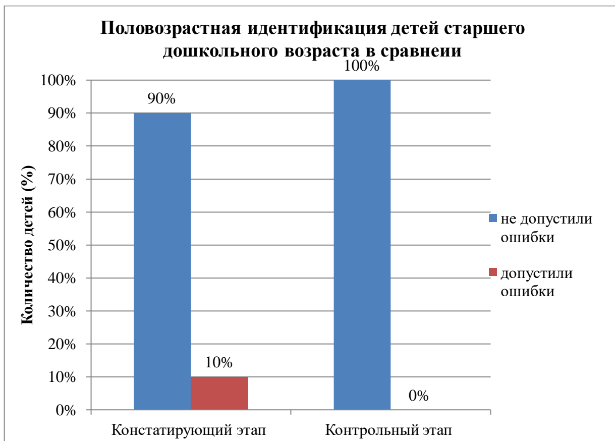
Рисунок 3. Сравнительные результаты изменения уровня развития половозрастной идентификации у детей старшего дошкольного возраста на контрольном этапе по методике исследования детского самосознания и половозрастной идентификации Н.Л. Белопольской

Согласно данным, на рисунке 3, отмечается положительная динамика показателей половозрастной идентификации старших дошкольников: увеличение числа испытуемых, которые безошибочно выстроили половозрастную идентификацию для себя и для противоположного пола - с 90% до 100%; не осталось детей, которые бы не справились с выстраиванием половозрастной цепочки.