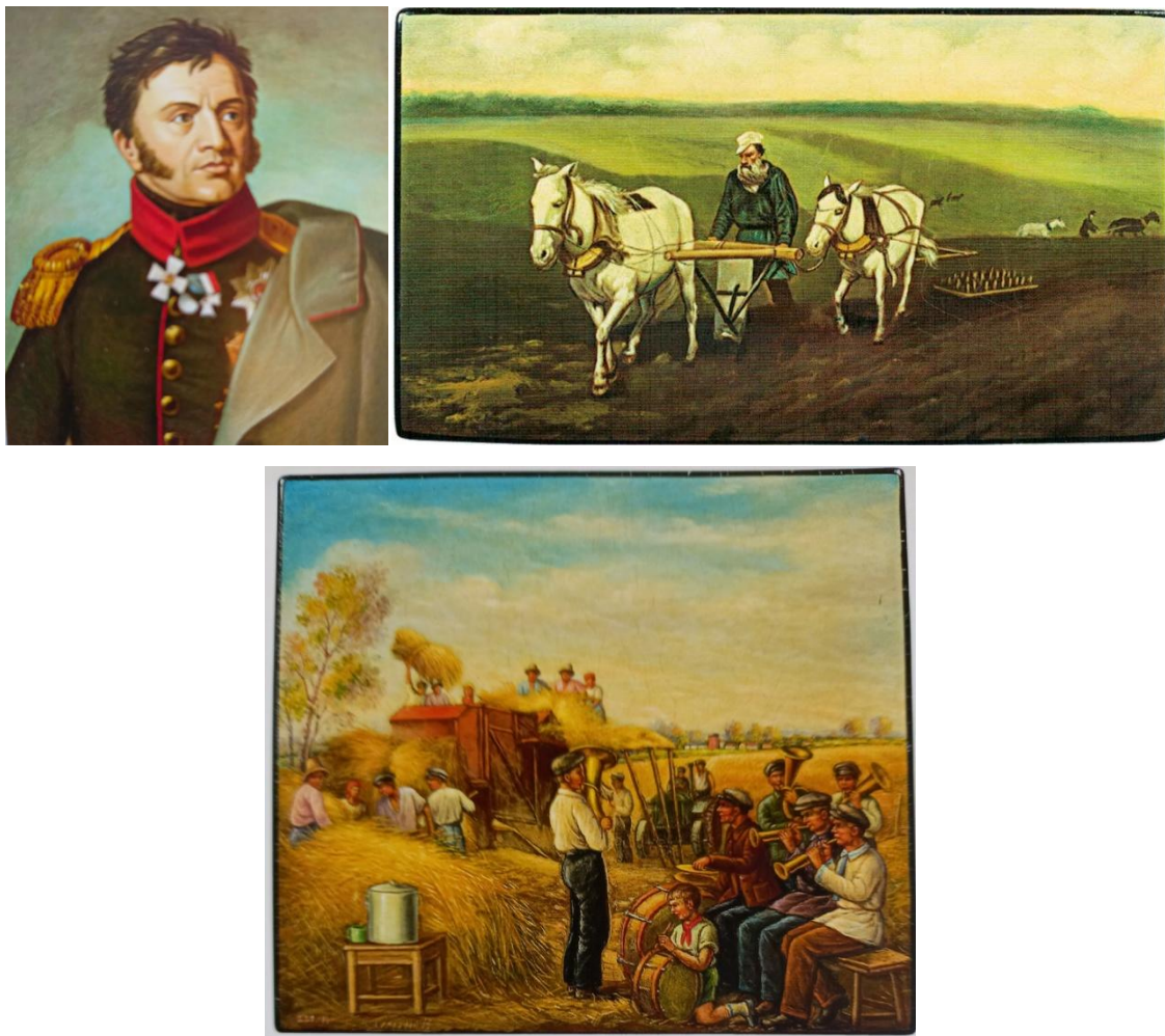
Рис. 3. Слева: миниатюрный портрет Н. Н. Раевского, Федоскинская трудартель, 1913 93 . Справа: шкатулка «Лев Толстой на пашне», там же, 1920-е 94 . Снизу: И. С. Семёнов. Шкатулка «Последний день молотбы», Федоскино, 1938 95 .

Иллюстративный материал кейса сопровождается заданием. Задания идентичны для всех четырёх кейсов и состоят из трёх вопросов.