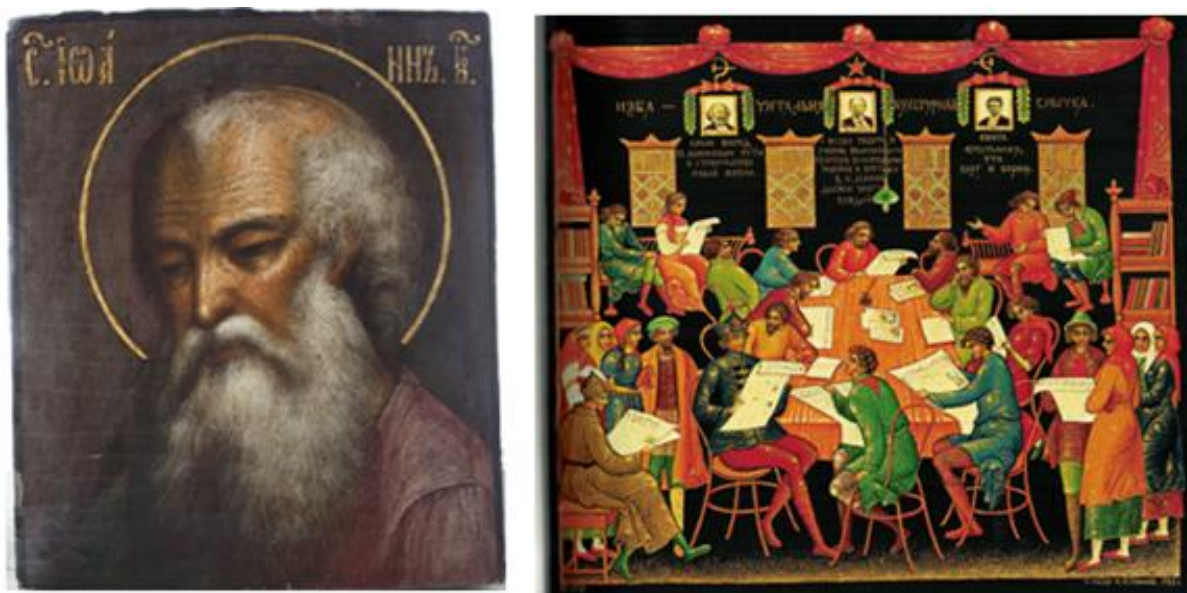
Рис. 1. Слева: М.П. Баканов. Икона «Иоанн Богослов», Палех, конец XIX века 90 . Справа: И.М. Баканов. Шкатулка «Изба-читальня», Палех, 1925 91 .