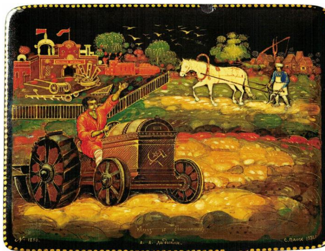
Рис. 2. А.А. Дыдыкин. Табакерка «Колхозник и единоличник», Палех, 1931 92 .