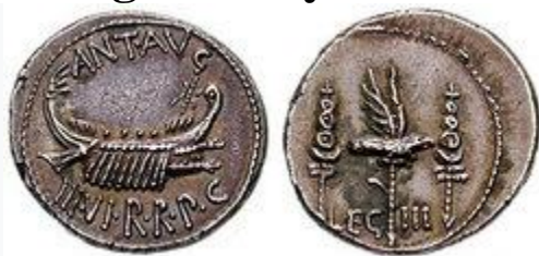
Денарий Марка Антония с упоминанием III Киренайского легиона

Начальные страницы этого легиона малоизвестны. Возможно, он был создан членами Второго триумvirата Марком Эмилием Лепидом 46 , или Марком Антонием 47 . До 36 года до н. э. Киренаикой управлял Лепид, а позднее - Марк Антоний. Однако можно предположить и другое. В 30 году до н. э. легион, принявший участие в походе Октавиана на Египет, совершил поход в Киренаику 48 , за что и получил свое наименование как I Киренайская когорта лузитанов и II Киренайская когорта испанцев-щитоносцев. Тогда мы можем считать его одним из поздне-республиканских легионов Цезаря. Именно этот факт является первым достоверным сведением его существования.