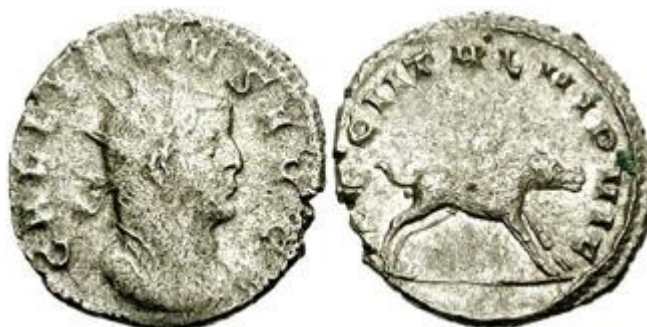
Сестерций с символом легиона XI Claudia с волчицей

Один из четырех легионов, из сформированных в 58 г. до н. э. Цезарем по решению Сената и триумвиров Первого триумvirата (Красс, Помпей, Цезарь) для выполнения проконсульских обязанностей в Иллирике и всех Галлиях.