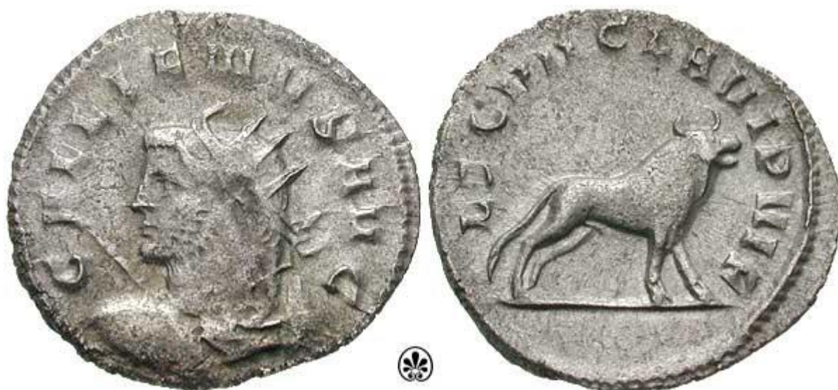
Римский денарий в честь побед VII Клавиева легиона

Часть происходит из позднереспубликанских легионов Юлия Цезаря, образованных в 58 г. до н. э. для завоевания Трансальпийской Галлии. При Цезаре легион прозывался Paterna («Старейший»).