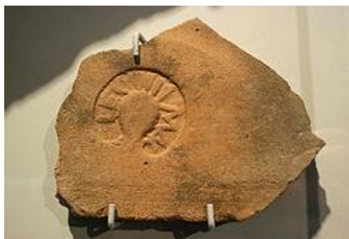
Кирпич с клеймом III Македонского легиона

Существует несколько предположений о начальной истории легиона, одно из которых считает основателем подразделения Гая Юлия Цезаря, создавшего его в 48 г. до н. э. для борьбы с коллегой и соперником по Первому триумvirату Гнеем Помпеем Великим 73 . Другие утверждают, что его основал Марк Юний Брут в период бегства в Македонию в 44 г. до н. э., что и дало легиону его прозвище 74 .