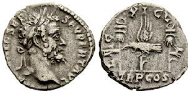
Денарий чеканки Юлия Цезаря в честь побед XI легиона с Нептуном