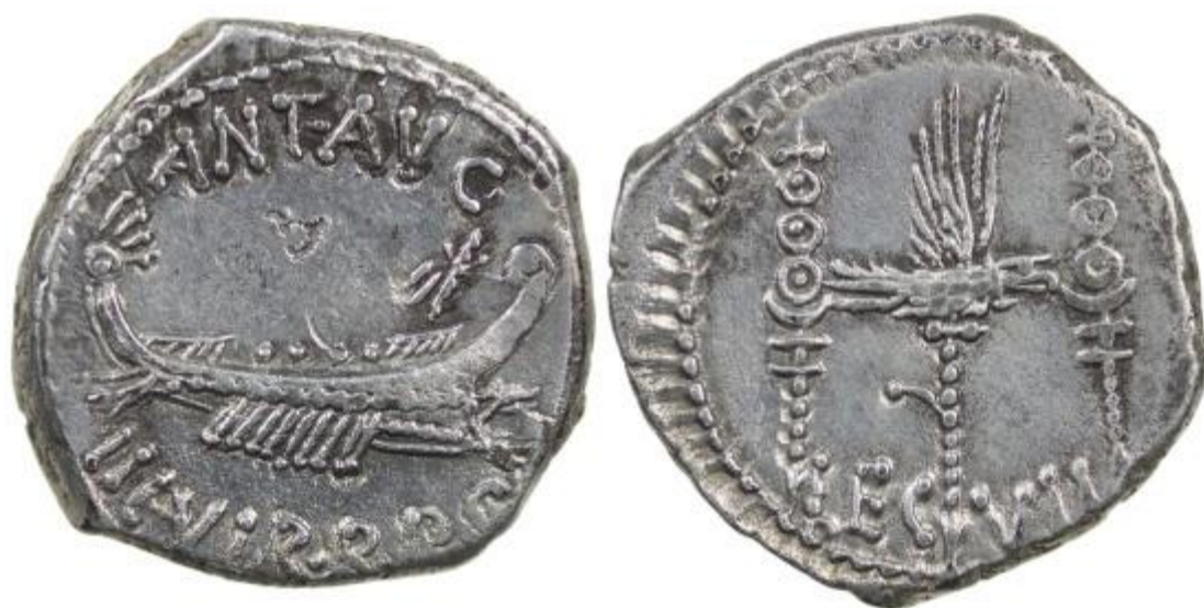
Римский денарий в честь легиона VIII Августова

Бык – священное животное верховного римского божества Юпитера, с другой стороны – родовой тотем плебейского рода Юлиев, возводивших свое происхождение к Юпитеру, поэтому символ бесспорно свидетельствует о происхождении данной воинской части из позднереспубликанских легионов Гая Юлия Цезаря.