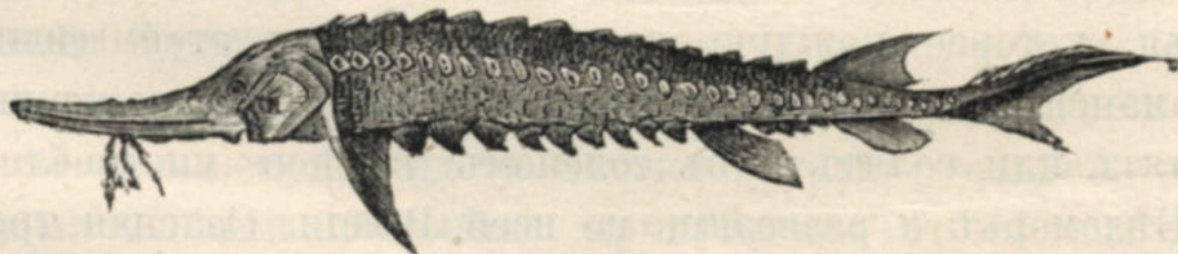
Рис. 410. Севрюга.

сѣверѣ, въ С. Двинѣ и на югѣ, въ Днѣпрѣ. Еще длиннѣе вытянуть носъ или, правильнѣе, конецъ головы у севрюги (рис. 410), покрытой большими, острыми костяными щитками, такъ называемыми — жучками. Огром-