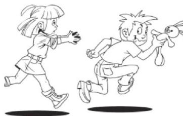
Рисунок 7. Мальчик взял без спроса игрушку девочки