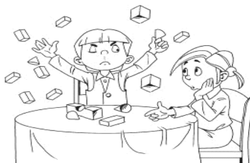
Рисунок 8. Мальчик рушит постройку из кубиков детей

Ребёнок должен понять изображённый на картинке конфликт между детьми и рассказать, что бы он стал делать на месте обиженного персонажа.