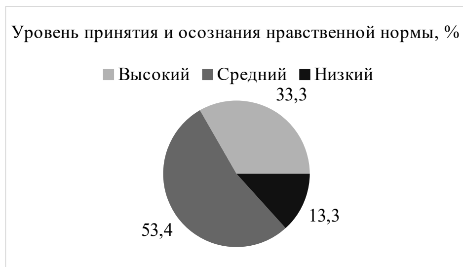
Рисунок 1. Процентное соотношение уровня принятия и осознания нравственной нормы у испытуемых по результатам методики «Неоконченные ситуации» Щетининой А.М., Кирс Л.В.

– и лишь у пяти детей (33,3% от общего количества детей) был определен высокий уровень принятия и осознания нравственной нормы.