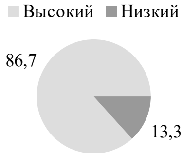
Рисунок 3. Процентное соотношение уровня развития социального интеллекта по методике «Картинки» О.Е. Смирновой, Е.А. Калягиной

Полученные результаты диагностик позволяют подобрать материал для подготовки дистанционного образовательного модуля детям среднего дошкольного возраста, так как материал должен соответствовать уровню социально-коммуникативного развития и способствовать его улучшению. Также данные результаты стоит учитывать при составлении рекомендаций для родителей и педагогов.