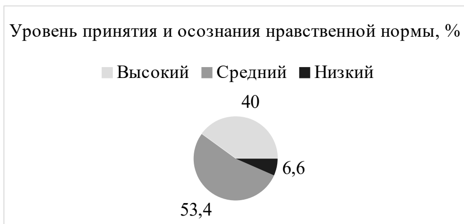
Рисунок 4. Процентное соотношение уровня принятия и осознания нравственной нормы у испытуемых по результатам методики «Неоконченные ситуации» Щетининой А.М., Кирс Л.В.

По полученным результатам в ходе диагностики экспериментальной группы можно увидеть, что у одного ребенка уровень принятия и осознания нравственной нормы перешел с низкого на средний, так же у одного ребенка уровень принятия и осознания нравственной нормы перешел с среднего на высокий уровень, что может служить подтверждением действенности дистанционного образовательного модуля по социально-коммуникативному развитию.