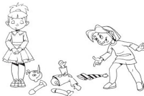
Рисунок 6. Девочка сломала у другой девочки ее куклу