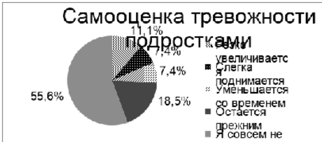
Рисунок 2 – Как вы оцениваете свою тревожность с начала пандемии COVID-19 и до сегодняшнего дня?

Большинство респондентов отметили, что с начала пандемии большинство не ощущают тревогу (Рисунок 2).