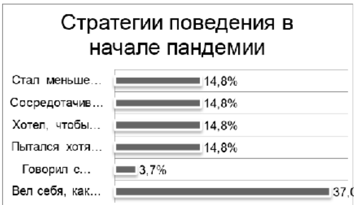
Рисунок 3 – Когда объявили о пандемии COVID-19 и назначили ограничения, что вы предприняли?

выбрали вариант «вел себя, как будто ничего не произошло» - 37%. Каждый из вариантов: «пытался хотя бы временно отстраниться от проблемы с помощью деятельности» и «хотел, чтобы все это скорее закончилось» имеют по 14,8 %, что может характеризоваться неким избеганием проблемы.