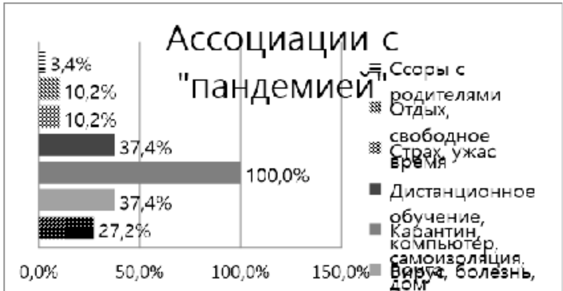
Рисунок 1 – Назовите 3-5 ассоциаций, которые у вас вызывает слово «пандемия»?

Большинство респондентов отметили, что с начала пандемии большинство не ощущают тревогу (Рисунок 2).