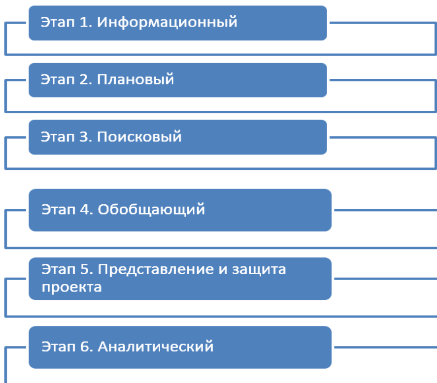
Рисунок 4. Этапы работы над учебным исследовательским проектом

Согласно рисунку, работа над исследовательским проектом делится на 6 этапов. Отдельно раскроем сущность каждого этапа: