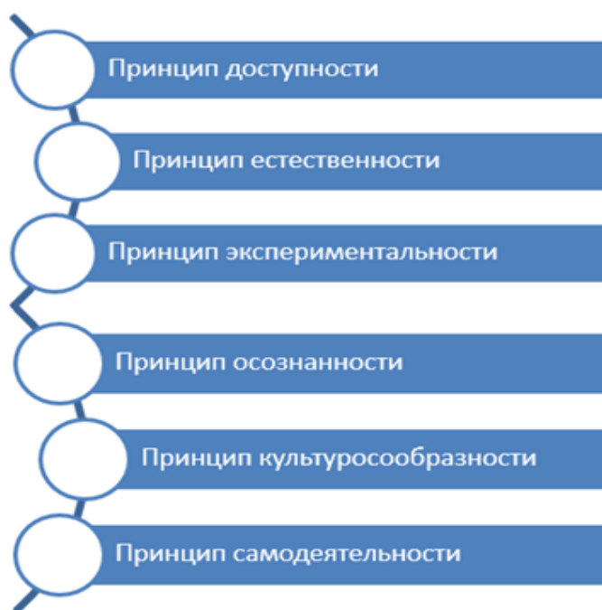
Рисунок 1 – Принципы организации учебно – исследовательской деятельности 17

Стоит сказать о том, что организация учебно – исследовательской деятельности для раскрытия ее развивающего потенциала должна опираться на ряд принципов, обратим внимание на рисунок 1.