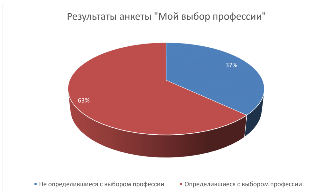
Рисунок 3. Результаты анкеты «Мой выбор профессии»

После обработки результатов анкетирования было выявлено, что 10 из 27 школьников так и не определились с выбором будущей профессии, что составляет 37% от общего коллектива. Казалось бы – меньше половины и тем не менее, это такие же люди, которым в будущем просто придется так или иначе найти свою нишу. Именно поэтому процесс обучения и воспитания старших подростков должен быть направлен прежде всего на сферу самоопределения.