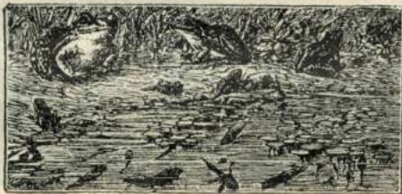
Рис. 75. Лягушка и жаба

Ихъ называютъ головастиками. Пока головастики растутъ, у нихъ понемногу уменьшается хвостъ и