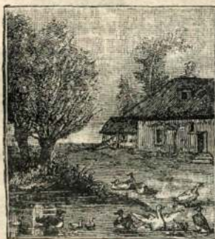
Рис. 63. Утки и гуси.

лебеди; это бесполезныя, но очень красивыя птицы; у нихъ длинныя, гибкія шеи и такое бѣлое опере-