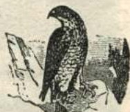
Рис. 58. Соколы.

У хищныхъ птицъ сильный, загнутый внизъ клювъ.