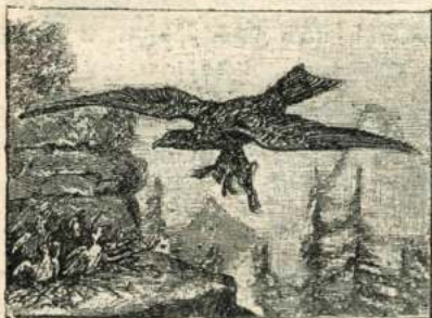
Рис. 57. Альпійскій орелъ несетъ добычу своимъ орлятамъ.

(рис. 59) напоминаютъ гіѣнъ, они тоже питаются падалью.