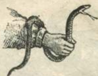
Рис. 71. Ужъ.

Черепахи. Черепаха (рис. 74) — странное животное съ холодной кровью; у нея, какъ у птицъ, есть клювъ. Нѣкоторыя изъ ея костей срослись и