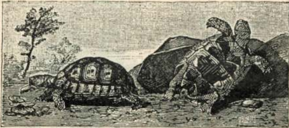
Рис. 74. Черепаха; виденъ ея верхнiй щитъ.

ная вещь: изъ яицъ, которыя лягушки и жабы кладутъ въ нашихъ болотахъ, выходятъ маленькiя животныя, у которыхъ есть хвостъ, но нѣтъ ногъ.