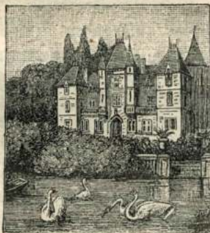
Рис. 64. Лебеди.

ніе, что они напоминаютъ большіе хлопья снѣга, плавающіе на водѣ.