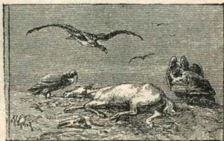
Рис. 59. Грифы.

Есть орлы такіе большіе и сильныя, что они могли бы унести въ своихъ когтяхъ ребенка. Но обыкновенно орлы довольствуются тѣмъ, что уносятъ куръ и ягнятъ. Каждый изъ этихъ хищниковъ преслѣдуетъ болѣе слабого.