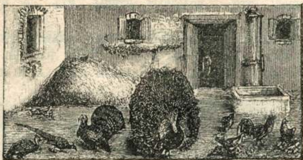
Цесарка. Фазанъ. Индюкъ. Павлинъ. Штухъ и куры. Рис. 62.

Въ пруду передъ богатымъ домомъ плаваютъ