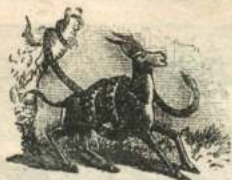
Рис. 72. Удавъ сжимаетъ газель.

образуютъ какъ бы ящикъ, изъ котораго животное можетъ высовывать голову, ноги и хвостъ. Есть