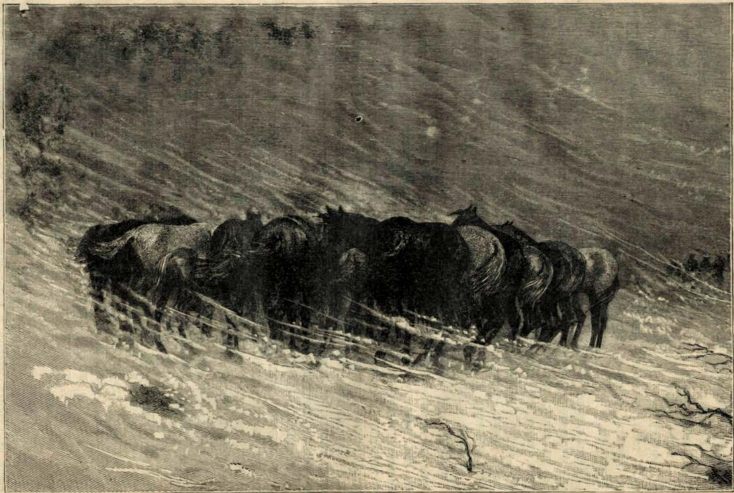
Буранъ въ южно-русскихъ степяхъ.