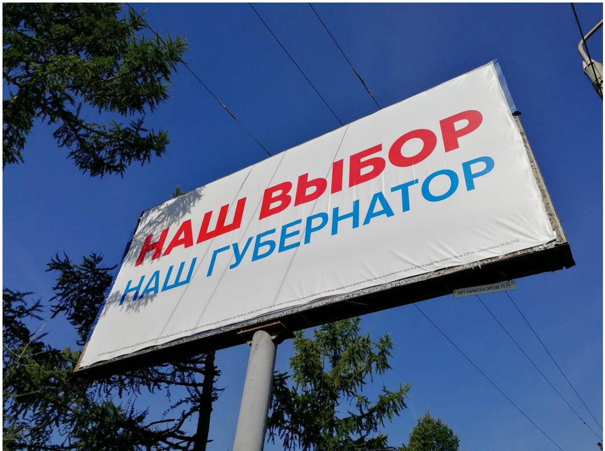
Рис. 2 Баннер предвыборной кампании Александра Усса на выборах губернатора Красноярского края 2018 года.