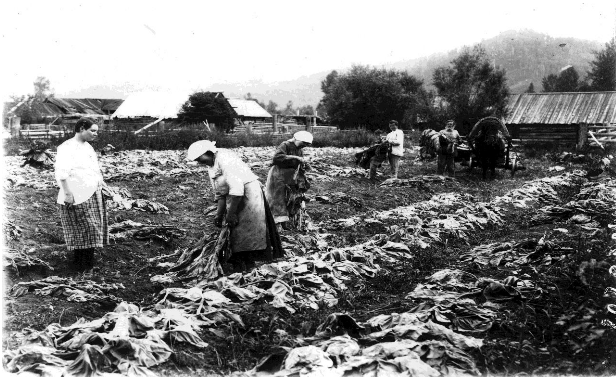
Уборка табака в Минусинском уезде. Фотограф неизвестен. Минусинский уезд. 1916 г. Негатив черно-белый, стекло, 8,9x11,8. Оригинал Количество 1. Хорошая.

На снимке: на задах крестьянской усадьбы, на огороде, идет уборка табака, часть которого вырвана и уложена рядами. Листья табака по форме широко-копьевидные с толстыми листовыми жилами. Слева, выпрямившись, стоит (с ножом в руках) молодая девушка. Две другие женщины в передниках обрезают корни растений. На заднем плане телега, запряженная в одну лошадь, на которую двое мужчин укладывают подготовленные табачные стебли с листьями. Вдалеке покрытая лесом сопка, защищающая культуру от холодных ветров, слева постройки, заросший плетень.