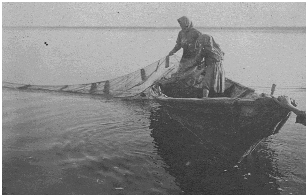
Лов тугуна на станке Верхне - Инбацком Туруханского края. Фотограф неизвестен. Ст. Верхне - Инбацкое. Нач. XX в. Фотобумага, картон, 7,3x10,8. Количество 1. Загрязнена.

На снимке: на переднем плане дощатая накладная лодка с заостренной носовой частью и расширенными бортами. По бортам две уключины для весел. Лодка пристает к берегу, с краю фотографии видна рука, подтягивающая ее. В лодке стоят женщина и девочка - подросток. Первая держит в руках верхнюю тетиву (веревку) невода, вторая - нижнюю тетиву. Невод мелкочейистый, на верхней тетиве видны деревянные плашки - плутева, служащие поплавками, закрепленными на расстоянии друг от друга; на нижней тетиве виден прикрепленный камень, служивший грузилом. Женщина и девочка одеты в темную рабочую одежду. Фоном служит плоское широкое полотно реки с едва виднеющимся берегом вдали. Станок Верхне - Инбацкое Туруханского края находился на р. Енисей, насчитывал в 1911 г. 21 двор с числом жителей более 120 человек. На станке имелись церковь, школа, хлебозапасный магазин.