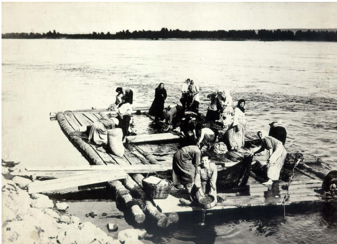
Прачки на Енисее. Неизвестен. Г. Красноярск. Нач. 1900-х. гг. Негатив черно-белый, пленка, 8x11,4. Количество 1. Хорошая.

Групповой фотопортрет женщин-прачек (всего 16 человек), стирающих на плоту белье. Вероятно, на фото изображен тот же самый плот, что и на предыдущей фотографии, но в другое время: схоже устройство мостков, рельеф каменистого берега, панорама правого берега Енисея. Плот крепится к берегу металлическим тросом, берег и плот соединяют сходни из досок. На плоту корзины, мешок с бельем. Женщины в повседневной рабочей одежде из фабричных набивных тканей, все босы. На переднем плане на коленях стоит молодая женщина, полощущая в решете орехи, зерно, крупу (? изображение неотчетливое).