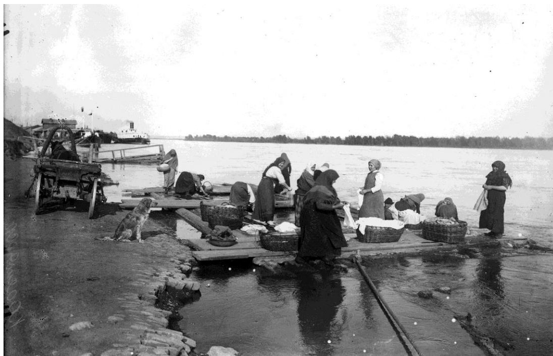
Портомойня на Енисее. Г. Красноярск. Нач. 1900-х гг. Негатив черно-белый, стекло, 12,7x17,7. Оригинал. Количество 1. В сохранности.

От Н.Н. Карташева, топографа Переселенческого управления, в 1916 г. ККМ о/ф 8056.