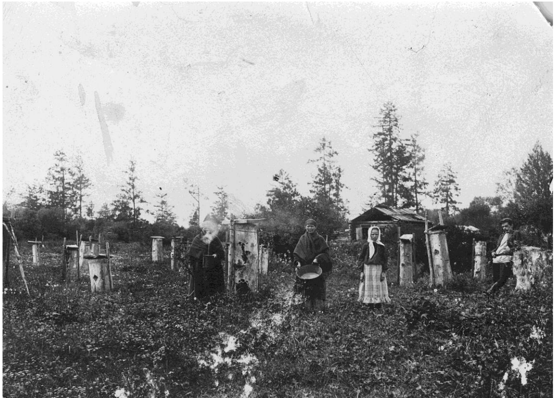
Пасека в д. Арбаты Минусинского уезда. Фотограф неизвестен. Д. Арбаты. 1907 г. Негатив черно-белый, стекло, 8,8x11,7. Оригинал. Количество 1. Удовлетворительное.

На снимке: на поляне установлено несколько ульев-дуплянок из деревянных колод, с выдолбленными внутри дуплами - "бортями": У нескольких дуплянок спереди видны маленькие отверстия - летки. Часть дуплянок для устойчивости привязана к вбитым в землю кольям, каждая сверху прикрыта доской. Около самого большого улья стоит женщина с дымокурором в руках, женщина справа разбрасывает из посуды подкормку для пчел. Позади жилое строения, лес. На обороте печать Красноярского городского музея.