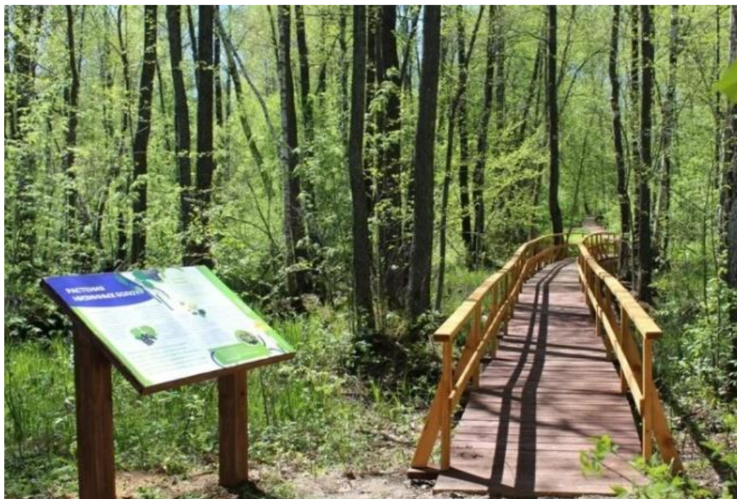
Рис.3. Оборудованная экологическая тропа и с информационным щитом.

специально изготовлены для создания экологической тропы, - информационные щиты (рис.3), указатели, площадки для отдыха, макеты, беседки, мостики, питомники редких и лекарственных растений, почвенные разрезы, искусственные кострища, гнездовья для птиц и т.п. Эти объекты должны органично вписываться в окружающий ландшафт [3].