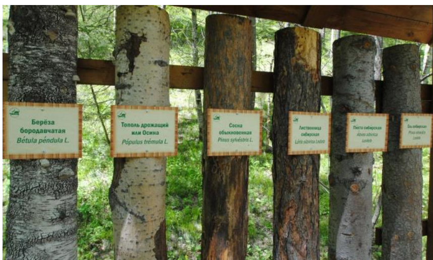
Рис. 5. Информационный интерактивный стенд «Виды деревьев».

Кроме того, тропа оснащена наличием интерактивного познавательного оборудования. Экотропа «Книга природы» появилась осенью 2011 года, в рамках реализации заповедником федеральной программы развития познавательного туризма.