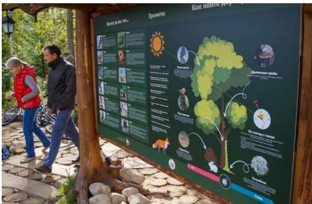
Рис.2. Информационный щит на экологической тропе.

д) тропа должна нести информацию: познавательную (натуральные объекты: виды растений и животных, формы рельефа, почвы, горные породы и другие элементы живой и неживой природы); просветительную (элементы антропогенного ландшафта) и предписывающую (лозунги, призывы, правила, указатели, помещенные на щитах и знаках) (рис.2);