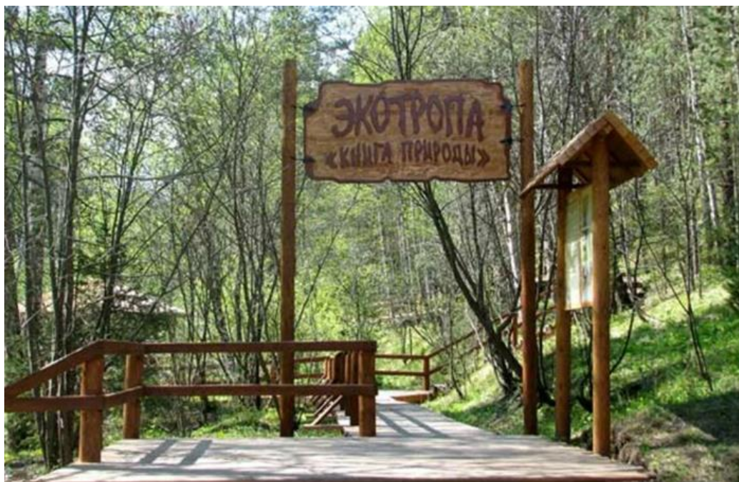
Рис.4. Экотропа «Книга природы».

«Книга природы» (рис.4) - это познавательная обучающая экологическая тропа в туристско-экскурсионном районе заповедника «Красноярские Столбы», которая пользуется популярностью у школьников, их родителей и учителей.