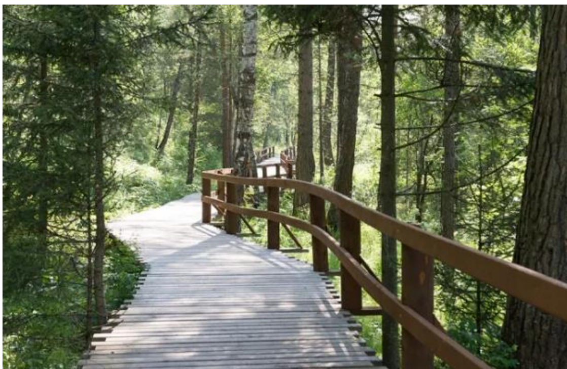
Рис.6. Настилы на винтовых сваях на экотропе «Книга жизни».

Проходит экотропа вдоль существующей автомобильной дороги по левому берегу реки Лалетино от часовни св. Иннокентия до Первой Поперечной (Ретро площадки).