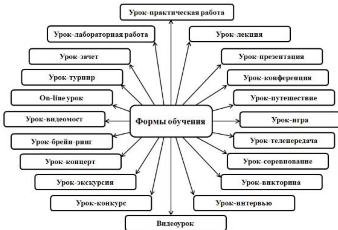
Рис. 1. Формы обучения.

факультативные и индивидуальные занятия, предметные кружки и т.д. Но помимо таких организационных форм обучения существуют еще и нетрадиционные, интерактивные, игровые формы, которые также необходимо включить в процесс обучения.