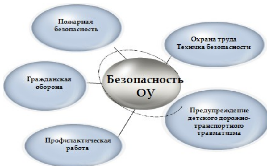
рис 1. Модель безопасного ОУ

Физическая безопасность школы – это вид безопасности образовательного учреждения, который отвечает за сохранение и развитие физического здоровья и физическую безопасность всех людей, находящихся в ОУ, гарантирует их, создаёт специальные условия для их жизнедеятельности, обеспечивает правопорядок и антитеррористическую защищенность, пожарную безопасность, безопасность при возникновении чрезвычайных ситуаций, безопасное поведение на дорогах, транспортную безопасность и охрану труда. Физическая безопасность обучающихся, сотрудников, учителей и родителей школьников должна напрямую, и лишь иногда косвенно зависеть от оборудования школы системами пожарной сигнализации, системой охраны важных помещений (библиотечный комплекс, компьютерные классы, кабинеты, школьная столовая и те помещения, которые напрямую связаны с жизнеобеспечением школы). В связи с угрозами террористического акта школа должна быть подключена к «Красной тревожной кнопке». Это очевидные и необходимые условия, обеспечивающие физическую защиту людей, имеющих к ней непосредственное отношение.