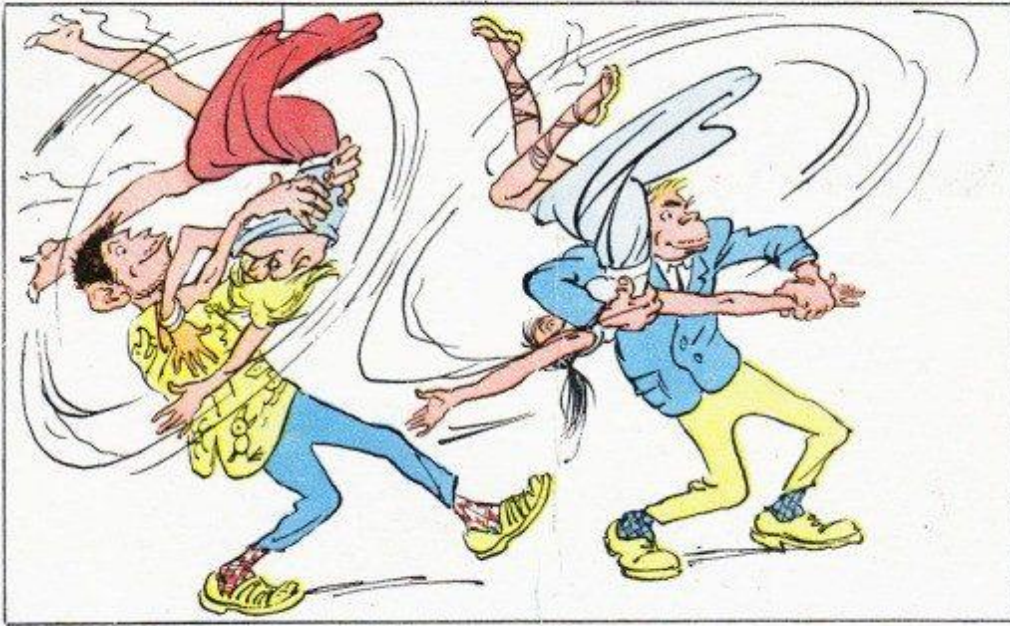
Рисунок А. БАЖЕНОВА.