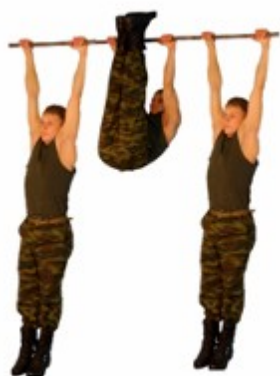
Рис. 5. Поднимание ног к перекладине

Упражнение 6. Подъем переворотом на перекладине (рис. 6).