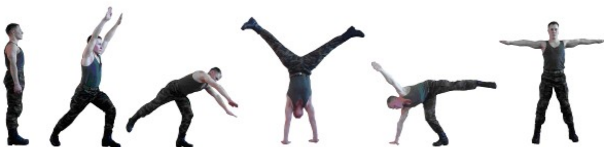
Рис. 19. Переворот в сторону.

Проводится в любом помещении или на ровной площадке.