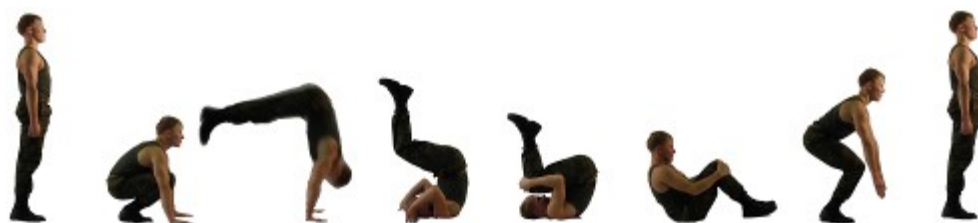
Рис. 17. Кувырок вперед.

Строевая стойка, упор присев, поставить руки вперед, наклоняя голову к груди, оттолкнуться ногами и, группируясь, выполнить перекат вперед в положение упор присев, встать.