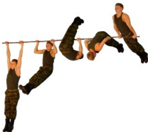
Рис. 6. Подъем переворотом на перекладине

Упражнение 7. Подъем силой на перекладине (рис. 7).