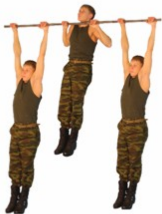
Рис. 4. Подтягивание на перекладине

Запрещается выполнение движений рывком и махом.