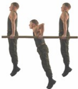
Рис.9. Сгибание и разгибание рук в упоре на брусьях

Упражнение 10. Угол в упоре на брусьях (рис. 10).