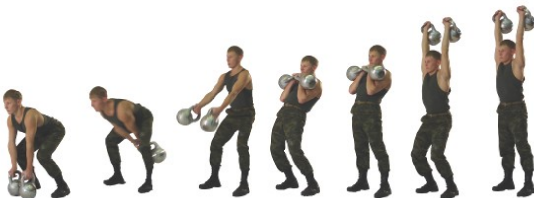
Рис. 22. Толчок двух гирь