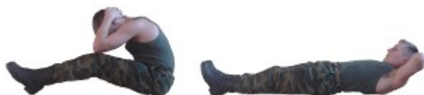
Рис. 15. Наклоны туловища вперед

Разрешается незначительное сгибание ног.