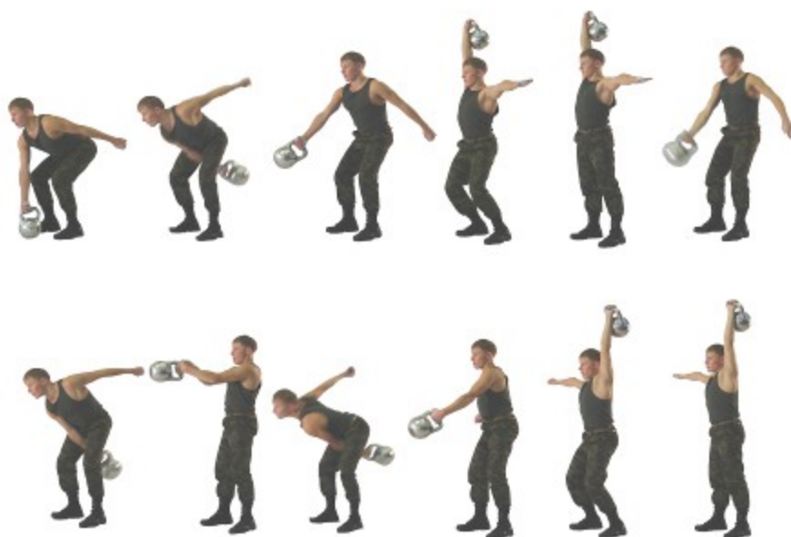
Рис. 21. Рывок гири

Установлены две весовые категории: до 70 кг, 70 кг и выше.