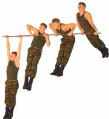
Рис. 7. Подъем силой на перекладине.

Запрещается выполнение движений рывком и махом.