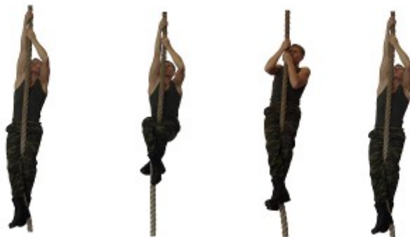
Рис. 20. Лазание по канату

Запрещается спрыгивать с каната выше отметки 2 м от пола.