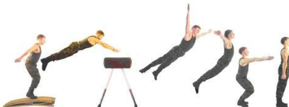
Рис. 12. Прыжок ноги врозь через козла в длину.

Прыжок выполняется с разбега, толчком ногами от мостика потянутся руками к опоре, поставить руки на нее, отталкиваясь развести ноги, руки вверх – в стороны, разгибаясь приземлиться.