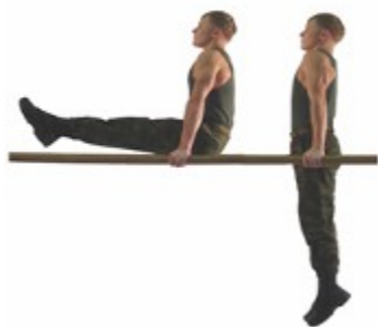
Рис. 10. Угол в упоре на брусках

Упражнение 12. Прыжок ноги врозь через козла в длину (рис. 12). Высота козла 125 см, мостик высотой 10-15 см., устанавливается произвольно.