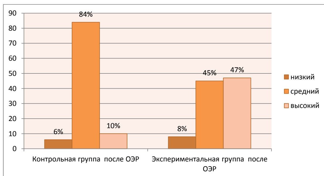
Рисунок 2 Показатели уровней эстетического воспитания школьников контрольной и экспериментальной группы на заключительном этапе опытно-экспериментальной работы