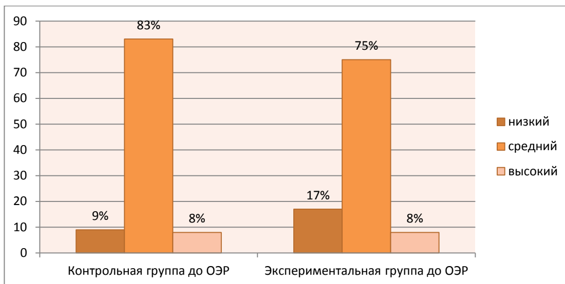
Рисунок 1 – Показатели уровней эстетического воспитания школьников контрольной и экспериментальной группы на начало опытно-экспериментальной работы

Результаты, полученные в ходе проведённого эксперимента, говорят о том, что основная масса школьников не задумываются о важности эстетического воспитания. Они не видят прямой связи эстетического и физического воспитания, основываясь тем, что на уроке физической культуры на первом месте развитие физических качеств и способностей, даже не подозревая, что в процессе занятий формируется красивая осанка, осуществляется гармоничное развитие форм телосложения, воспитывается понимание красоты и изящества движений и что физическое совершенство составляет часть эстетического идеала.