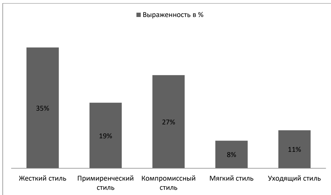
Рис. 4. Результаты диагностики по экспресс-диагностике поведенческого стиля в конфликтной ситуации (распределение в %)

Анализ когнитивного критерия проводился при помощи экспресс-диагностики поведенческого стиля в конфликтной ситуации. Суммируя количество баллов по каждой, выделенной тактике, мы вывели средний результат тестирования: