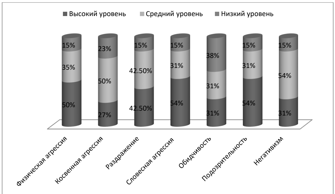
Рис. 2. Результаты диагностики по тесту эмоций (тест Басса-Дарки в модификации Г.В. Резапкиной) (распределение в %)

По аналогии с опросником Басса-Дарки выделим шкалы «индекс агрессии» и «индекс враждебности» и более подробно рассмотрим их.