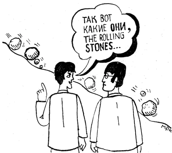
Иллюстрация для задания на определение юмористической составляющей