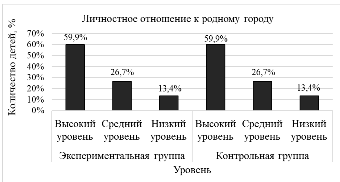
Рисунок 3. Результаты диагностики уровня личностного отношения к родному городу у детей старшего дошкольного возраста по заданию «Личностное отношение к родному городу» на констатирующем этапе

Данный критерий представлен одинаковыми значениями по уровням в обеих группах.