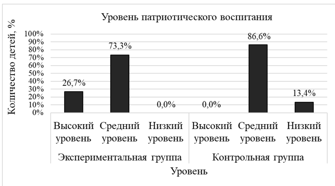
Рисунок 8. Результаты диагностики уровня патриотического воспитания детей старшего дошкольного возраста на контрольном этапе

Уровни патриотического воспитания изменились следующим образом. В экспериментальной группе высокий и средний уровни выросли на 26,7% и 6,6% соответственно, низкий уровень снизился на 33,3%. В контрольной группе высокий уровень остался без изменений, средний и низкий уровень изменились на 13,2%, средний – увеличился, низкий – уменьшился. Результаты представлены на рисунке 9.