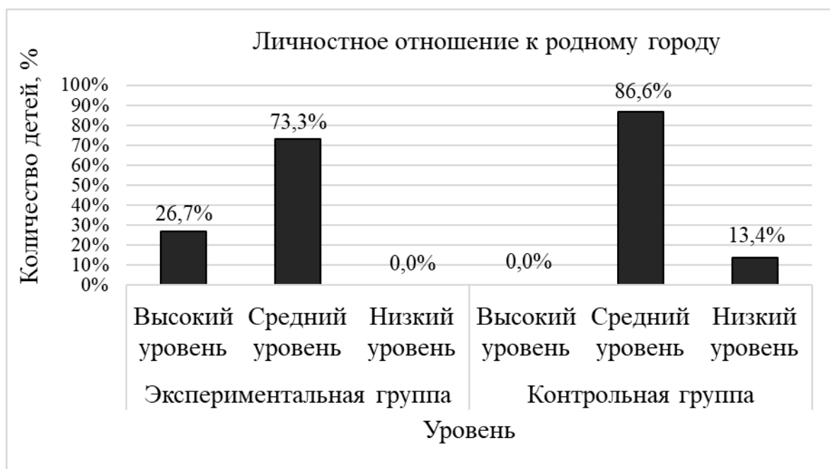
Рисунок 7. Результаты диагностики уровня личностного отношения к родному городу у детей старшего дошкольного возраста по заданию «Личностное отношение к родному городу» на контрольном этапе

На момент проведения диагностики на контрольном этапе в экспериментальной группе высокий уровень патриотического воспитания показали 26,7% детей, средний – 73,3% и низкий – 0%. В контрольной группе также преобладает средний уровень, он составляет 86,6%, тогда как высокий уровень не выявлен, а низкий уровень показали 13,4% детей. Результаты представлены на рисунке 8. По данным результатам, можно говорить о том, что в обеих группах большинство детей знают свои ФИО, название города и некоторые достопримечательности, также узнают больше достопримечательностей по картинкам. Некоторые дети могут узнать флаг и герб города.