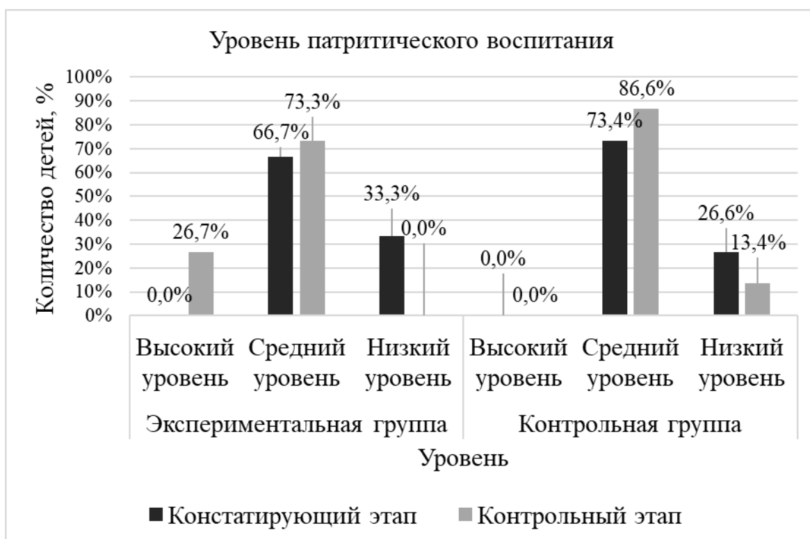
Рисунок 9. Сравнительные результаты диагностики уровня патристического воспитания детей старшего дошкольного возраста на констатирующем и контрольном этапах

Подводя итоги, можно говорить о том, что результаты контрольного этапа в экспериментальной группе отличаются от данных в контрольной группе в положительную сторону. Таким образом, можно сделать вывод о том, что цель достигнута, задачи решены и гипотеза доказана.