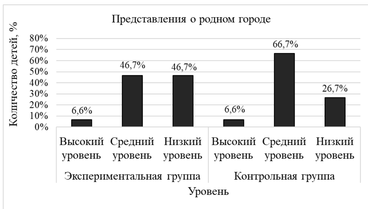
Рисунок 1. Результаты диагностики уровня представлений о родном городе у детей старшего дошкольного возраста по заданию «Родной город» на констатирующем этапе

Рассмотрим каждый показатель отдельно. Результаты по содержанию представления о родном городе представлены на рисунке 1.