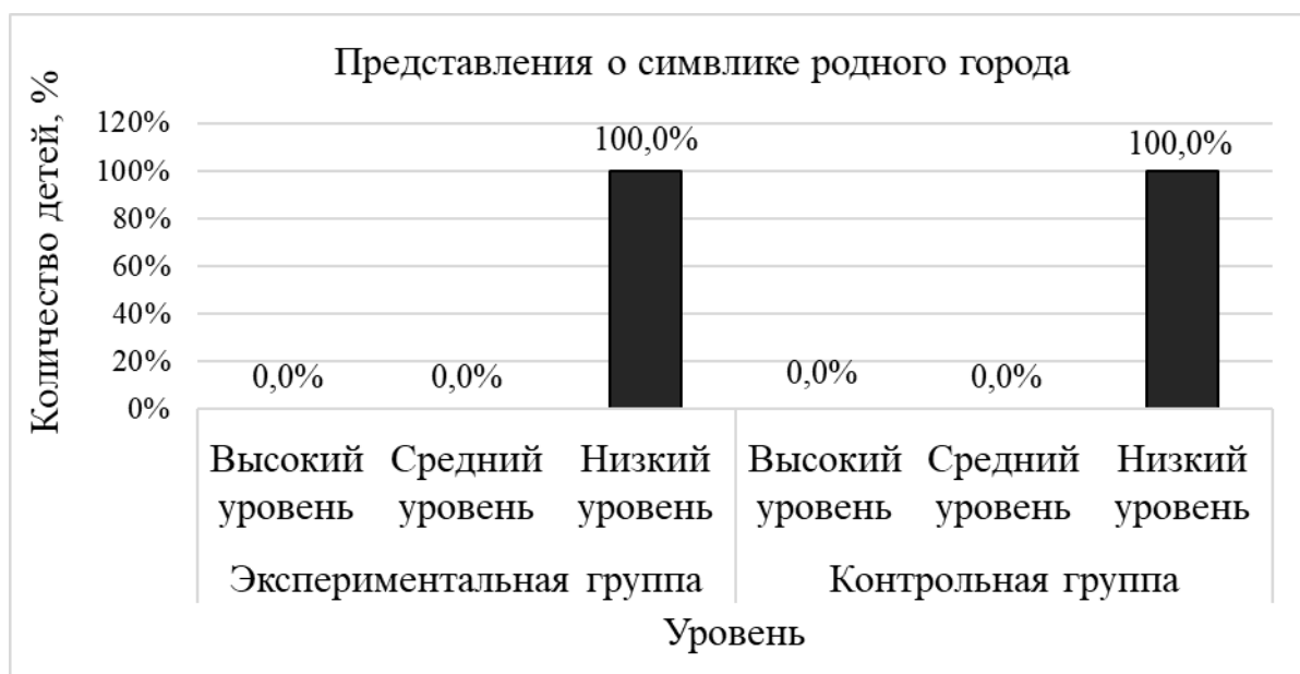
Рисунок 2. Результаты диагностики уровня представлений о символике родного города у детей старшего дошкольного возраста по заданию «Символика родного города» на констатирующем этапе

Далее рассмотрим представления о символике родного города. Результаты представлены на рисунке 2.