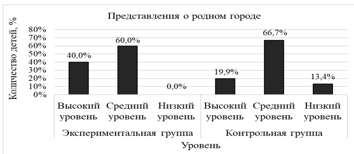
Рисунок 5. Результаты диагностики уровня представлений о родном городе у детей старшего дошкольного возраста по заданию «Родной город» на контрольном этапе

По заданию «Родной город» данные изменились следующим образом. Экспериментальная группа: высокий уровень вырос на 33,4%, средний – на 13,3%, низкий уровень снизился на 46,7%. Контрольная группа: высокий уровень повысился на 13,3%, средний остался неизменным, низкий уровень стал меньше на 13,3%. Результаты представлены на рисунке 5.