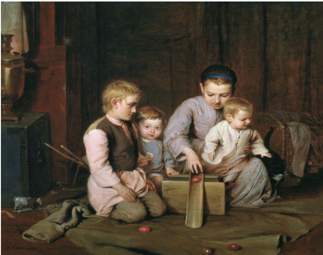
Н.А. Кошелев. «Дети, катающие пасхальные яйца». (1855)

Другая разновидность этой обрядовой забавы - катание яиц по желобкам или иначе – лоточкам. Обычно этим занимались взрослые (юноши/ мужчины) или дети – отдельно от взрослых. Женщины участвовали в этом развлечении очень редко. В местных традициях условия игры различались: в одних селах игроку надо было обязательно разбить яйцо соперников, в других – достаточно было ударить по нему своим крашеным яйцом.