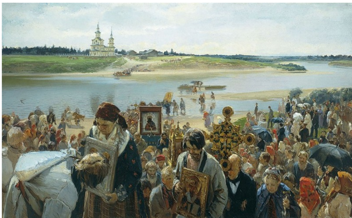
И. М. Прянишников «Крестный ход». (1893 г.)

До прихода «икон» не полагалось веселиться, петь, громко смеяться, и в центральной России. Веселье начиналось после совершения молебна [Шангина 2004, с. 89].