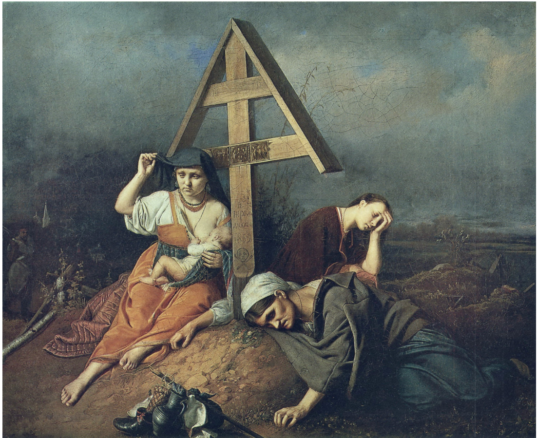
В. Г. Перов «Сцена на могиле». (1859 г.)

В ряде мест существовал обычай окликанья покойников в Христово воскресенье и даже диалога с ними. И. Калинин ссылается на Патерик Печерский, описывающий, как в 1463 г. тела печерских усопших святых ответили на пасхальное приветствие священника в Велик день» [Калинский 1997, с. 188].