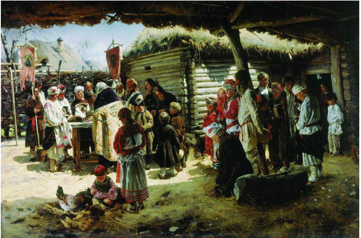
В.Е. Маковский «Молебен на Пасху» (1887-1888 г.)