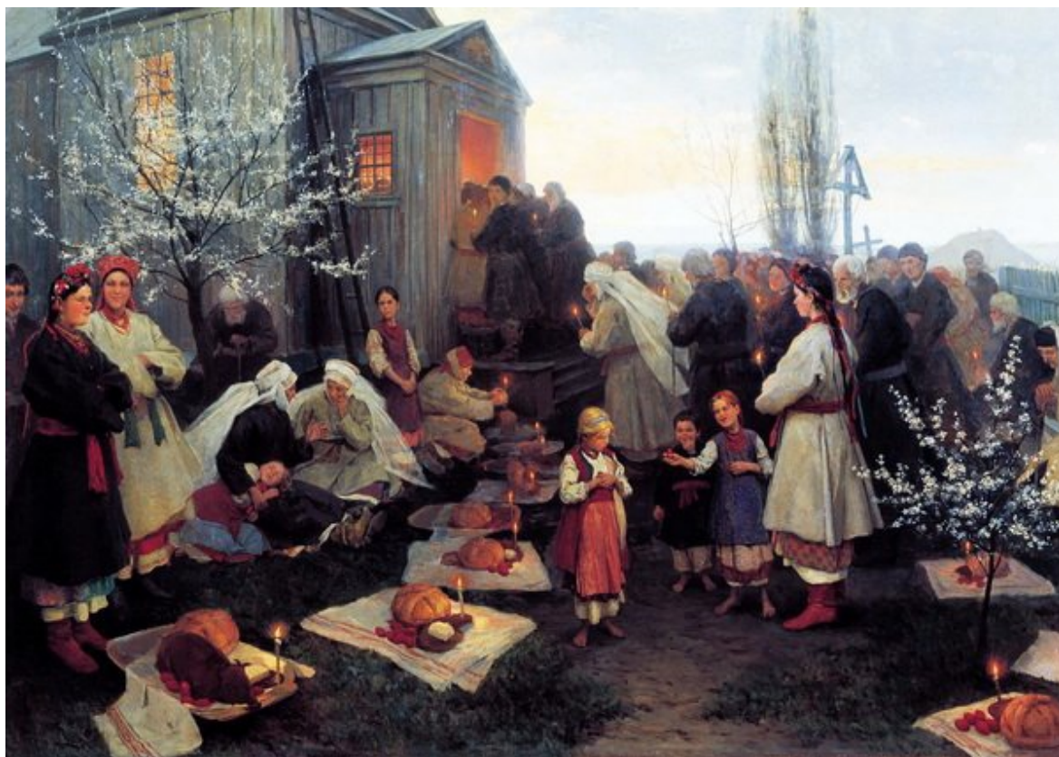
Н. Пимоненко «Пасхальная заутреня в Малороссии». (1891г.)

Обойдя церковь кругом, крестный ход подходил к запертой изнутри двери церкви. Запертая дверь символизирует камень, закрывающий вход в пещеру, где покоился распятый Христос. Затем священник, несший трехсвечник, отпирает церковь и объявляет о воскресении Христа. Эта часть богослужения называется Утреня, в народе ее часто именуют Заутреня. Вот как пишет об этом этапе службы Н.С. Шапарова: «Вернувшись к церковному порогу, священник объявлял о Воскресении Христовом, после чего вся толпа вновь устремлялась в церковь... Пасхальную Утреню начинали служить в церкви сразу после крестного хода» [Шапарова 2010, с. 343].