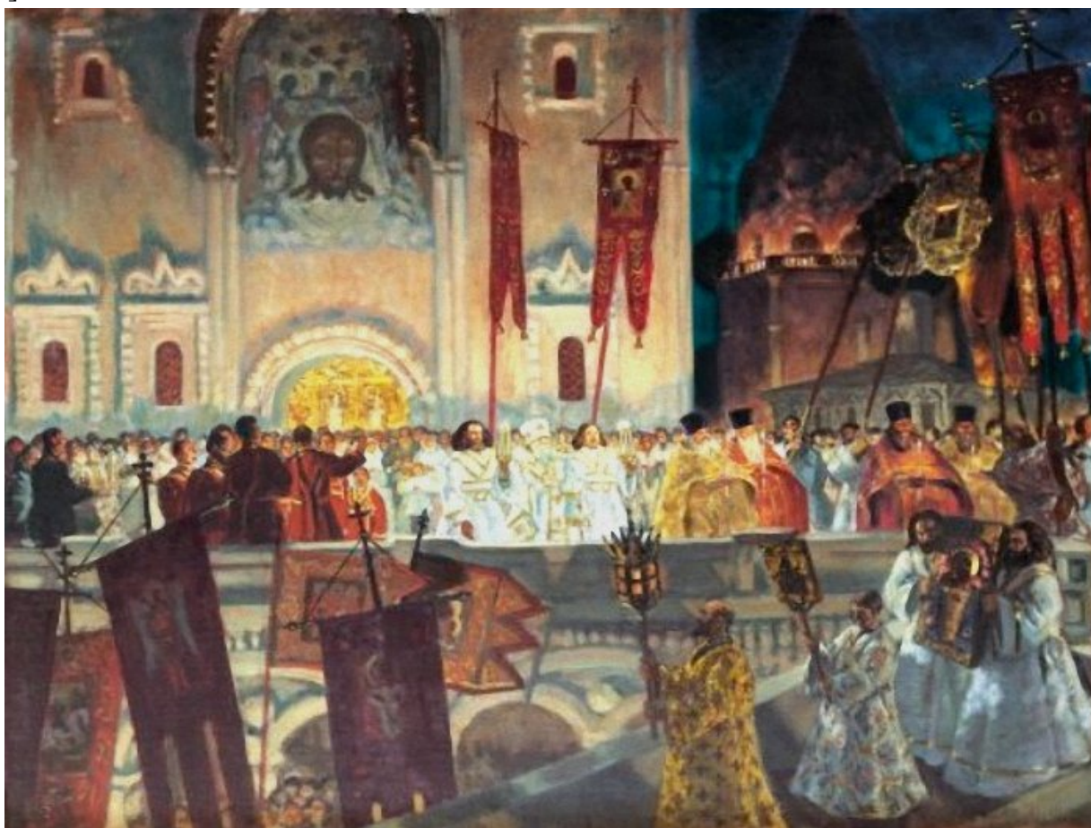
Б. М. Кустодиев «Пасхальная ночь». (1917г.)