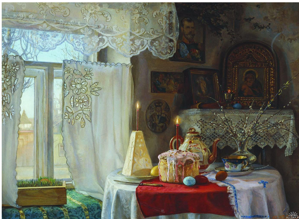
И. А. Каверзнев «Светлое воскресенье», 2005 г.

Подготовка к Пасхе включала также украшение жилища. Повсеместно вешались чистые занавески, стелились вышитые или кружевные «дорожки» и скатерти, украшался нарядными праздничными рушниками «красный угол». А в нашем крае еще было принято убирать к Пасхе дом пихтой. И этот вид украшения дома возник не случайно.