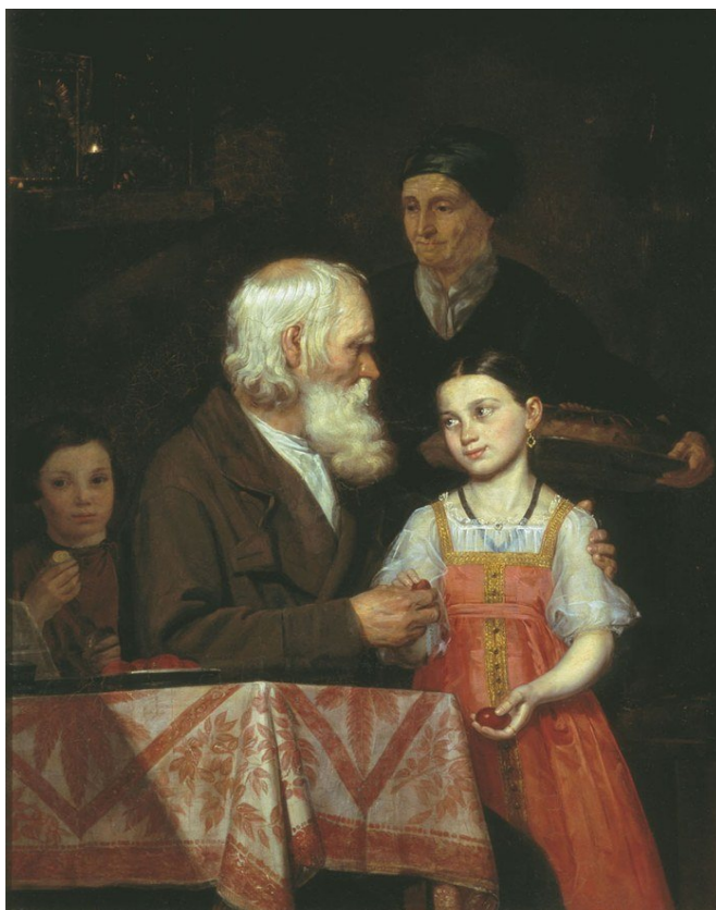
М.А. Мохов «Пасха», 1842 г.

Показательно, что многие действия в пасхальных обрядах направлены на разбивание яйца. Когда дети или взрослые «бились» яйцами, побеждал тот, чье яйцо было крепче. Выигравший обычно забирал разбитое яйцо себе. Хорошим предзнаменованием для семьи считалось, если ребенку или взрослому удавалось выбить (или собрать) много яиц.