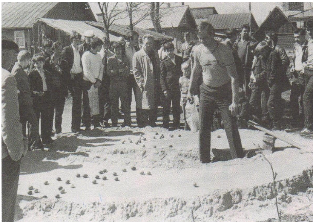
Катание яиц по земле (фото).