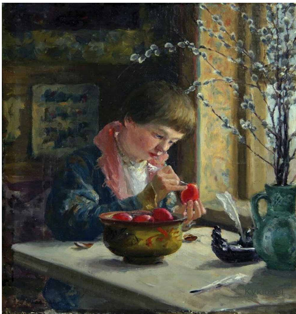
С. Д. Милорадович «Приготовление к пасхе». (1910 г.)

В 19 - начале 20 в. крестьяне некоторых местностей раскрашивали яйца узорами. У украинцев такие яйца назывались «писанками» [Соколова 1979, с. 76]. Узоры «писанок» должны были магически обеспечить благополучие в разных сферах жизни. Покрывая растительными символами (изображение ростков, цветов, веточек, колосьев, плодов), земледелец надеялся на получение хорошего урожая злаков, обилие трав, овощей и плодов. Если на яйце изображались птицы или животные, то крестьяне заклинали этим удачу в животноводстве, птицеводстве и охоте.