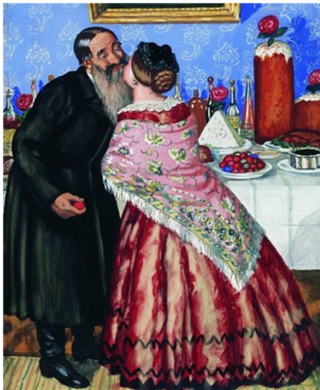
Б.М. Кустодиев «Пасхальный обряд. Христосование». (1916 г.)

Пасхальные приветствия родственников и знакомых сопровождалось «христосованием» - так назывался обычай троекратного целования при первом поздравлении с праздником Пасхи. Сама поздравительная формула не менялась веками, и в каноническом виде дошла до наших дней.