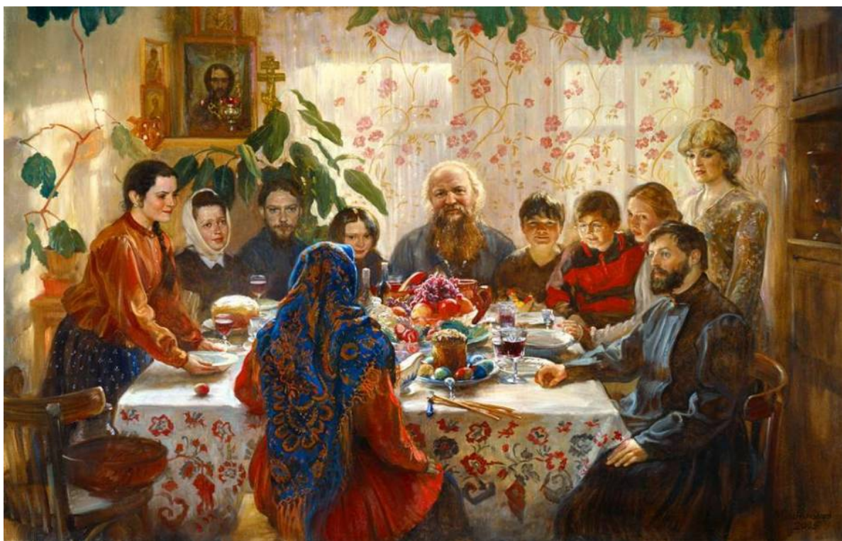
М. Шанько «Пасха»

все домочадцы, поскольку совместная еда – знак любви, взаимного внимания и единства семьи. Поэтому к пасхальному разговенью будили даже маленьких детей.