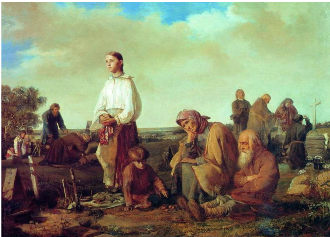
А. И. Корзухин «Поминки на кладбище». (1865 г.)

В Туле кладбища посещали в понедельник Святой недели, «отправляясь туда всей семьей и проводя там время до самого вечера: прибирали могилы, разговаривали с похороненными в них родными, рассказывали о своем житье-бытье, ели принесенную еду, разложив ее на столиках около могил или прямо на них. Несъеденную пищу оставляли здесь же, а питье выливали на землю возле креста» [Некрылова 2010, с. 693]. В.К. Соколова пишет о том, что на Украине в середине 19 века днем мертвых считался пасхальный четверг, его называли - "навськи вельк день"[Соколова 1979, с. 120]. Этот обычай дожил до 20 века лишь в локальных традициях, а на большинстве территорий он исчез.