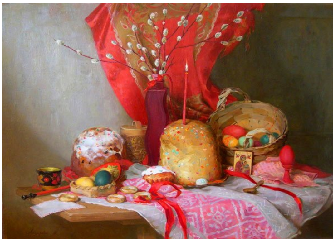
М. Лазарева «Пасхальный натюрморт»

Как в каждом крупном празднике, в пасхальной обрядности существовала особая еда. Ею были крашеные яйца и специальный сдобный, круглый хлеб. В одних местах его называли пасхой (паской), в других – куличом. В Енисейской губернии пасхальный кулич почти повсеместно называли «пасхой», или «паской».