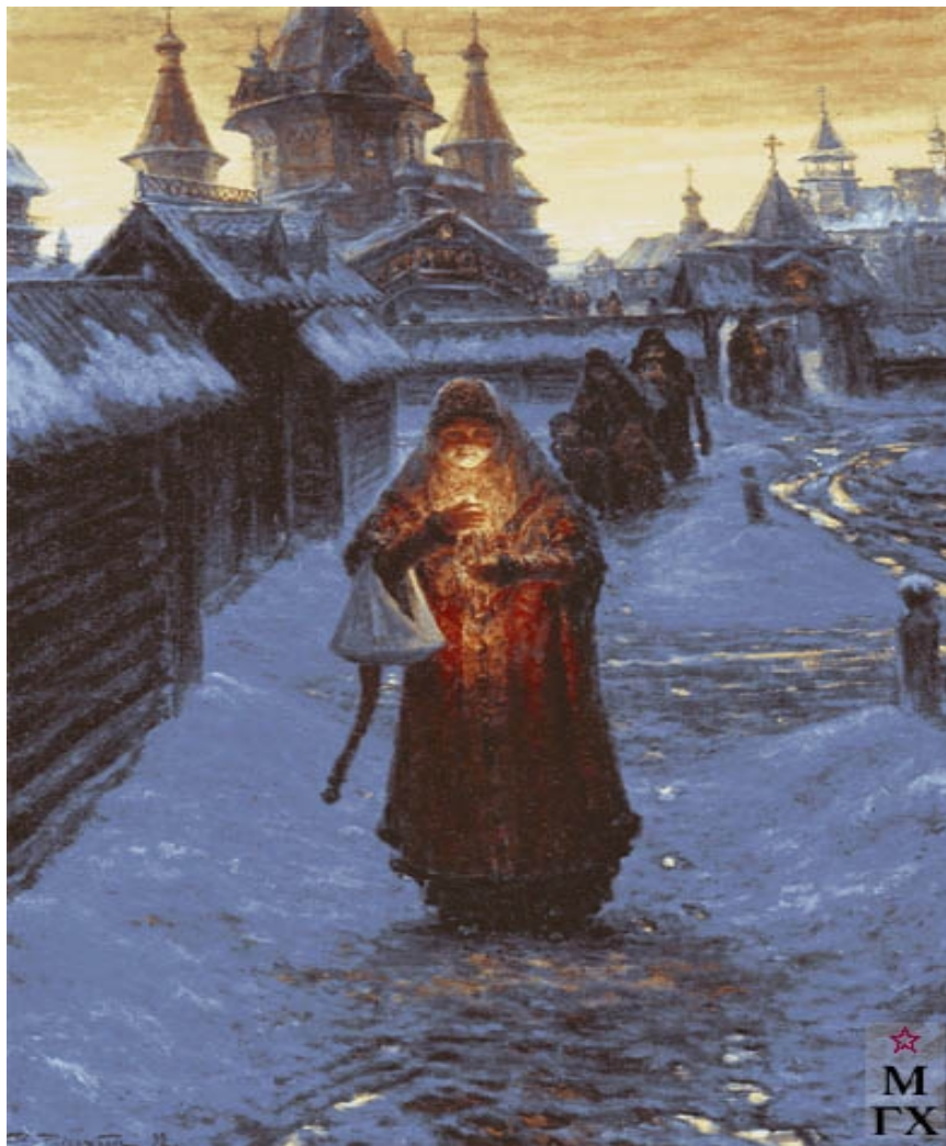
В. П. Рассохин «От Пасхальной заутрени». (1992 г.)

В некоторых населенных пунктах этот запрет соблюдали и в 20 веке.