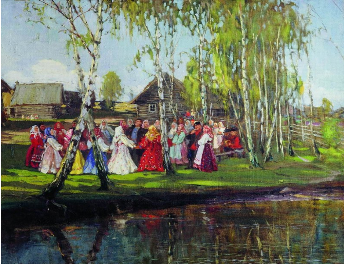
М. В. Боскин «Хоровод». (1910-е гг.)