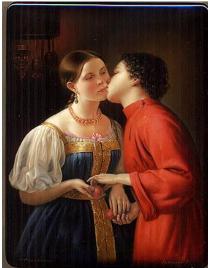
Ф. А. Горецкий «Христосование». (1850 г.)