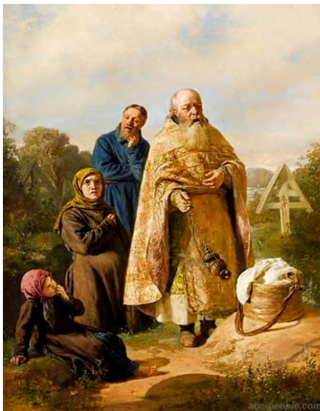
Н. В. Неврев «Панихида на сельском кладбище». (1865 г.)

В начале 20 века А.Макаренко отметил исполнение похоронных песен в д. Усольцевой Кежемской волости. [Макаренко 1907, вып.1, с. 6]. Во второй половине 20 века такие песни исполняли в Кежме, Болтурино, Кежемской заимке и других населенных пунктах Кежемского района. По жанровому составу это и традиционные протяжные лирические песни, и поздние, так называемые «городские». Такие песни в застольях и на отдыхе не исполнялись, у кежемцев они строго прикрепились к похоронам и поминальному обряду. В конце 20 века похоронный цикл обогащается новыми сюжетами. Со временем в него на ассоциативной основе включились произведения о дороге, о прощании, сиротстве и разлуке.