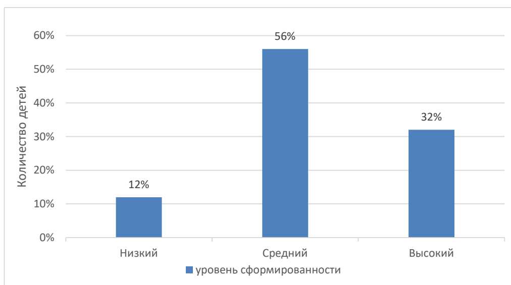
Рис. 3. Результаты диагностики уровня сформированности решительности младших школьников по методике проявлений решительности А. М. Щетининой.

Были получены следующие результаты (рис. 3):