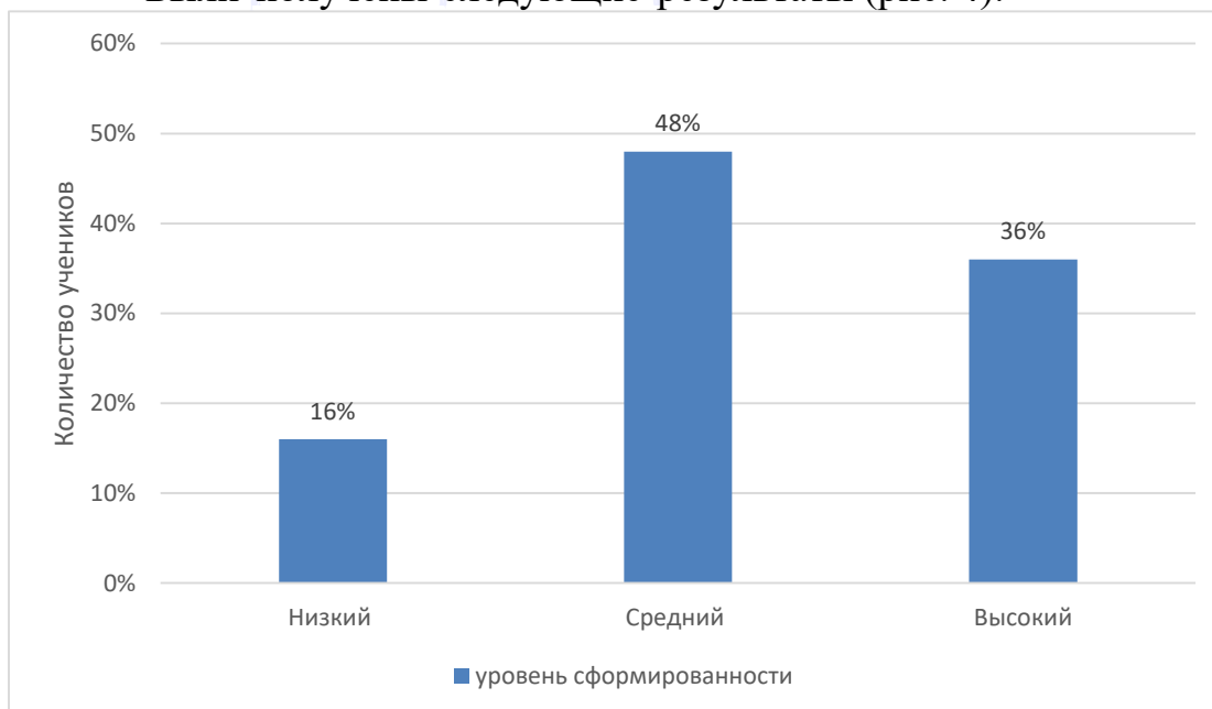
Рис.4. Результаты диагностики уровня инициативности младших школьников по карте наблюдения А. М. Щетининой

Были получены следующие результаты (рис. 4):