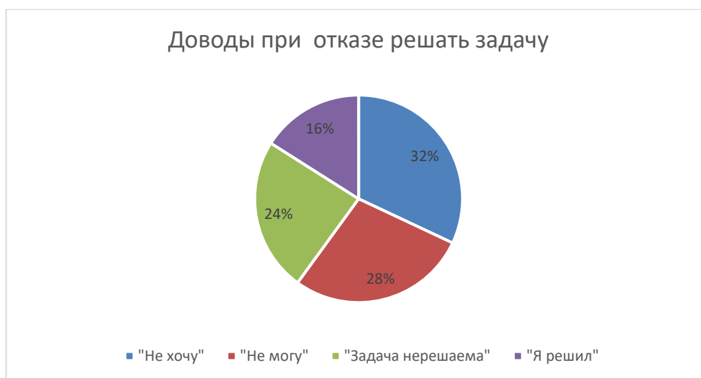
Рис. 2. Доводы при отказе выполнять задание младшими школьниками в методике «Нерешаемая задача» Н.И. Александровой и Т.И. Шульги

Соотношение учеников по выделенным группам таково (рис. 2):